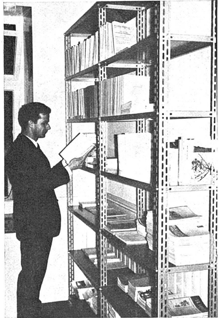
Local des archives