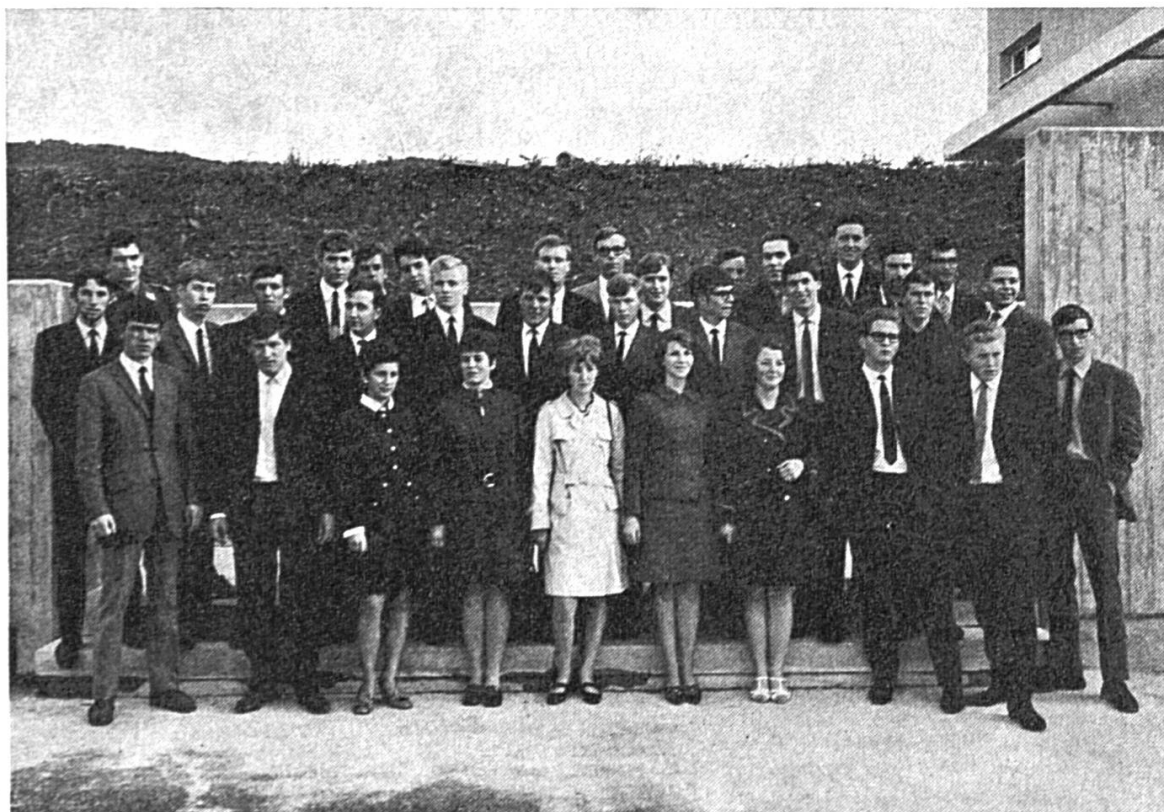
Les 37 apprentis méritants récompensés par l'ADIJ