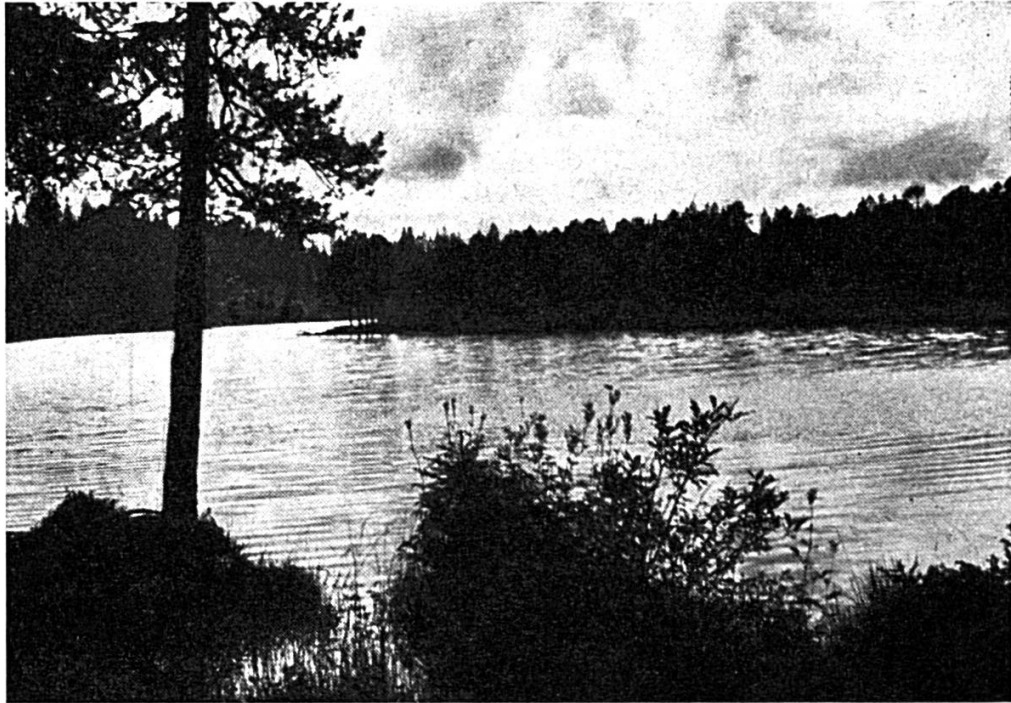
« Aussi tranquille qu'un lac finlandais »

Les « chers corbeaux délicieux », pour reprendre une expression de Rimbaud, ne joueront plus des tours pendables aux protecteurs de l'étang et de la tourbière de la Gruère, dans les Franches-Montagnes.