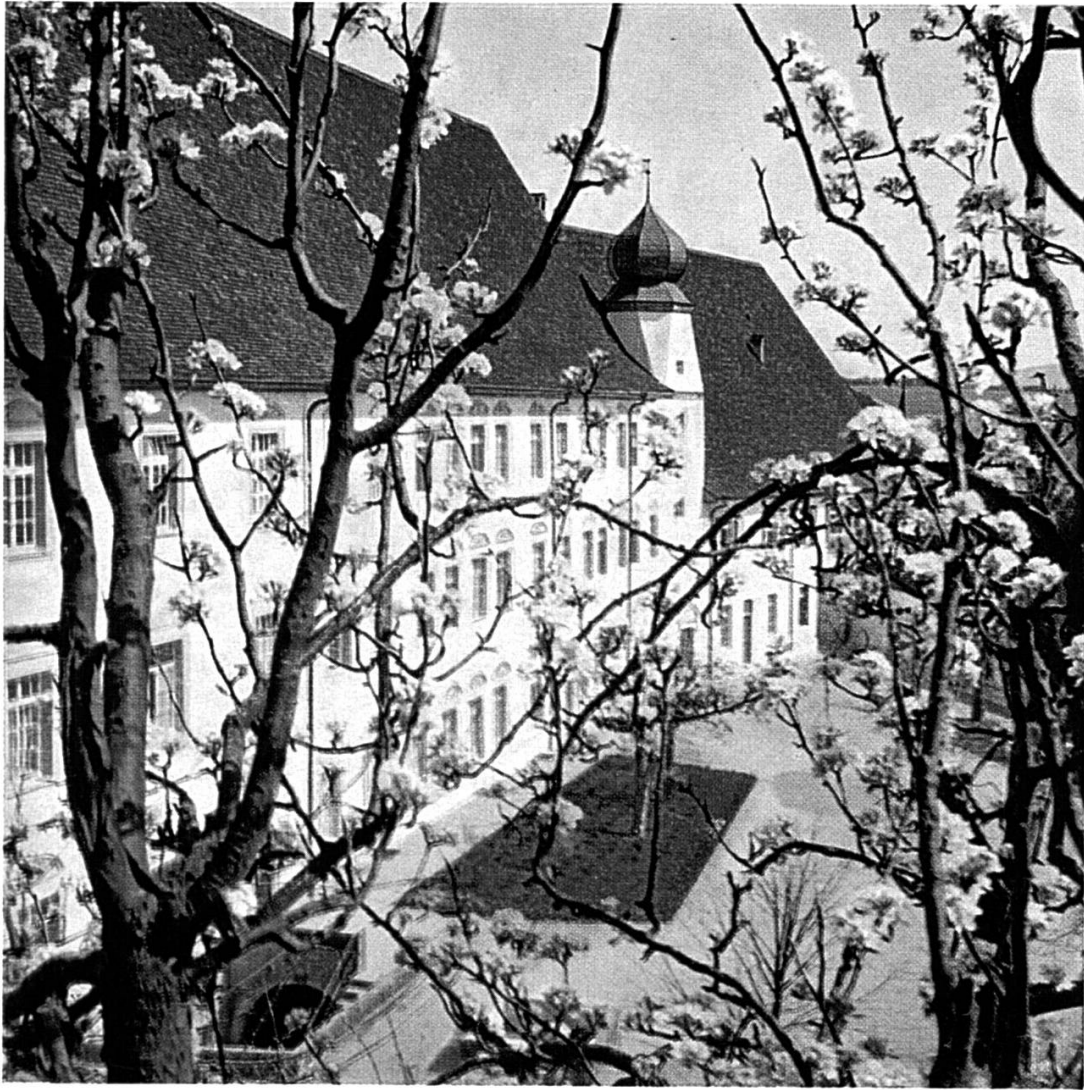
Château de Porrentruy