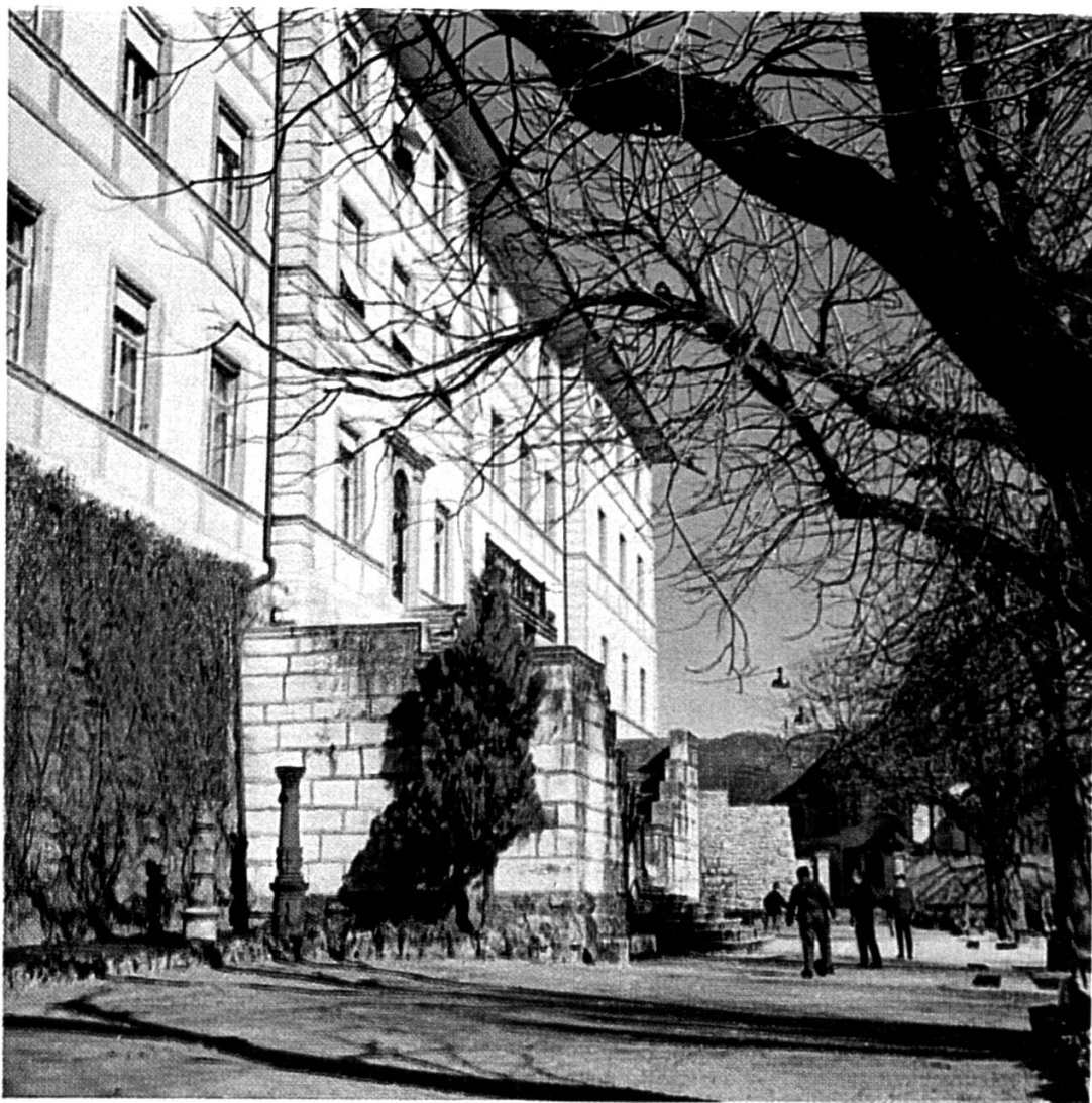
Château de Delémont