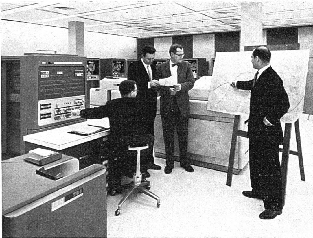
Le calculateur 3 BM géant 704 est utilisé pour calculer les orbites de satellites artificiels. Il est capable de donner la position d'un satellite à la seconde près et à chaque point où il passera au-dessus de la terre.