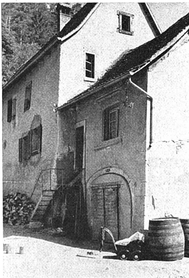
Vue du côté ouest avec les arcs maçonnés et l'escalier extérieur en fer.