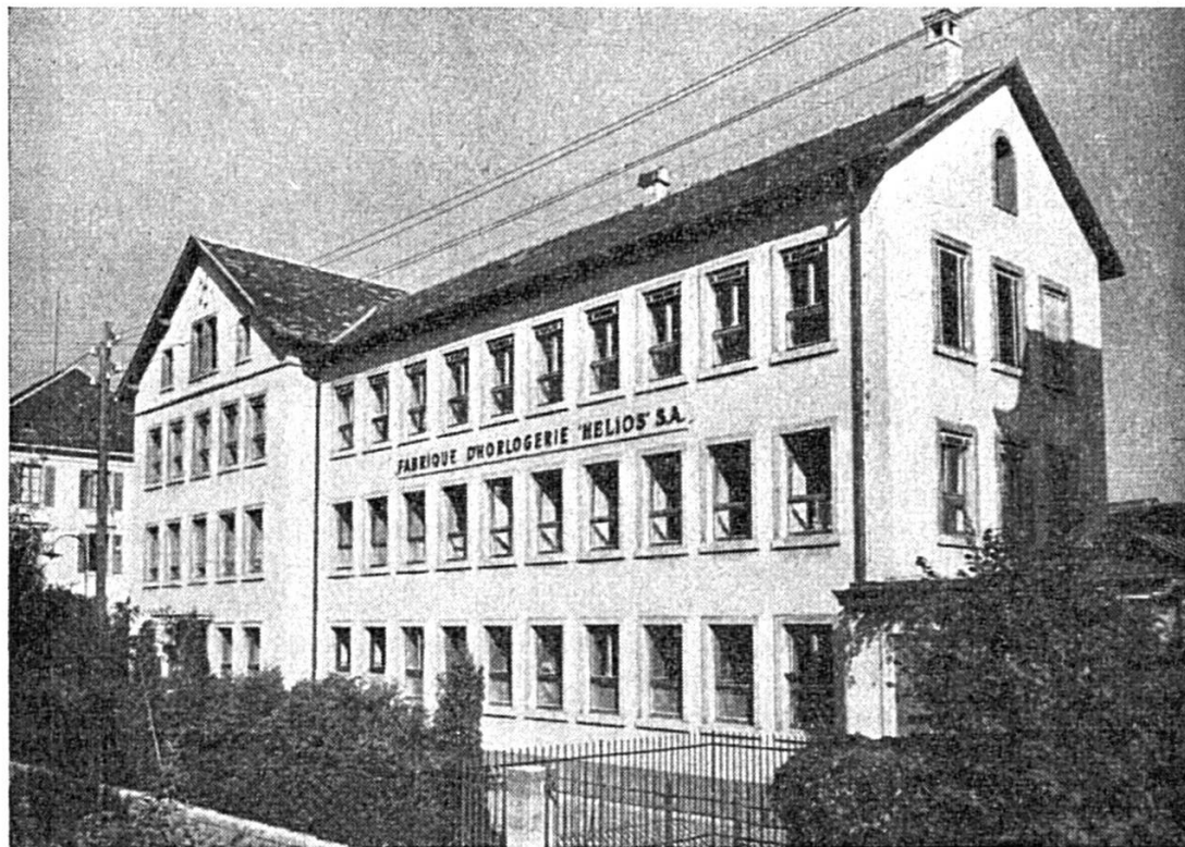
Vue de la fabrique

Cette société a pour but non seulement la fabrication et le commerce d'horlogerie, mais encore le décolletage. Elle succède à Gressot & Cie.