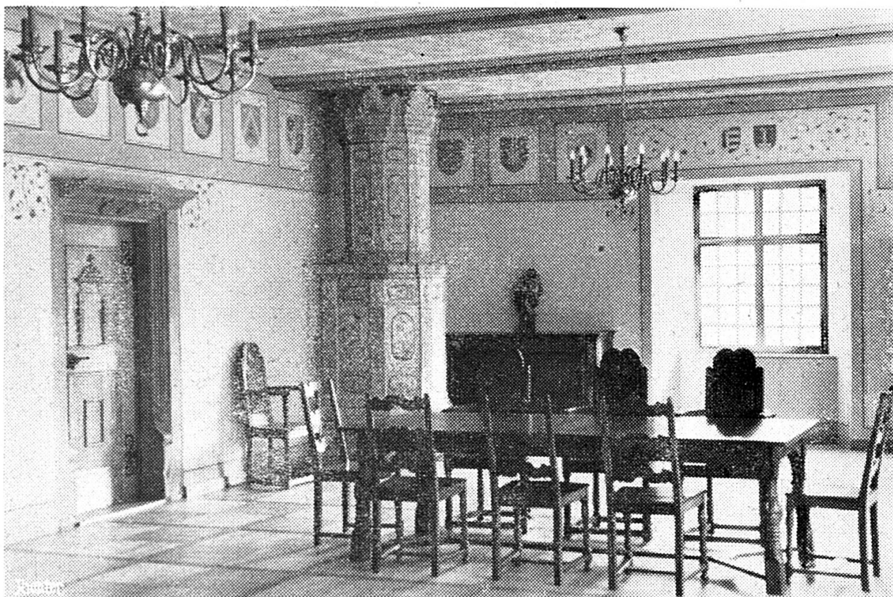
La Salle des Chevaliers.