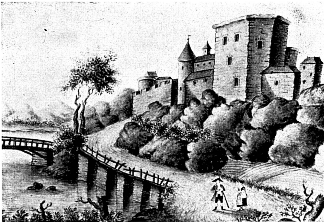
Le château d'Angenstein vu d'amont par un peintre occasionnel du XVIII e siècle. Cette aquarelle est déposée au musée jurassien, Delémont.

On nous signale qu'elle aurait l'intention de l'aménager afin d'y