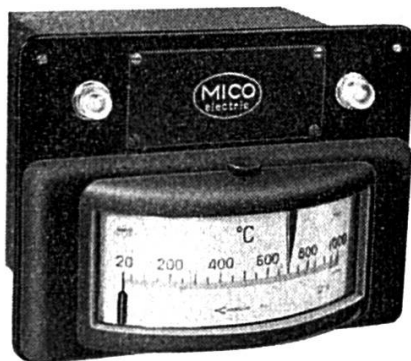
Régulateur électronique de température pour thermo-couple Hoskins Etendue de mesure : 20 — 1000° C

CIE. DES INSTRUMENTS DE MESURES ELECTRIQUES S. à r. l. BIENNE (Suisse) 22 rue de l'Hôpital, Tél. (032) 2 81 56