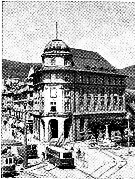
Hôtel de la Banque à Bienne