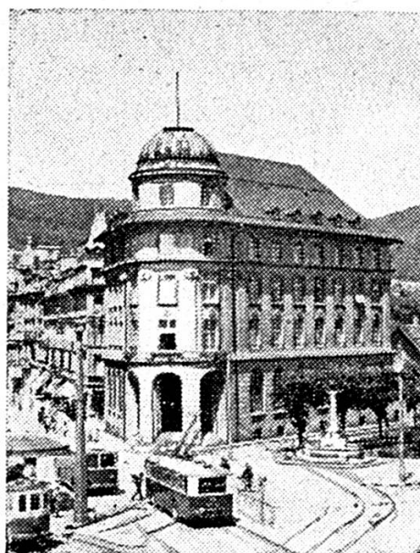
Hôtel de la Banque à Bienne.