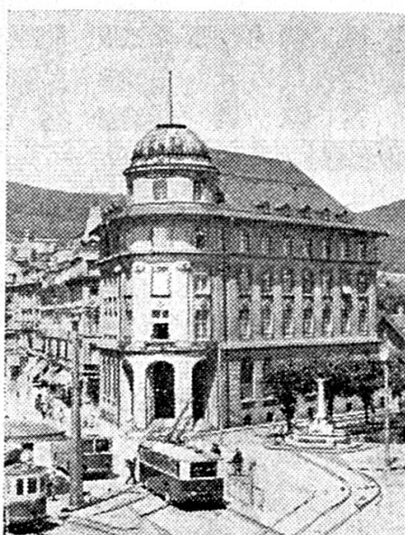
Hôtel de la Banque à Bienne