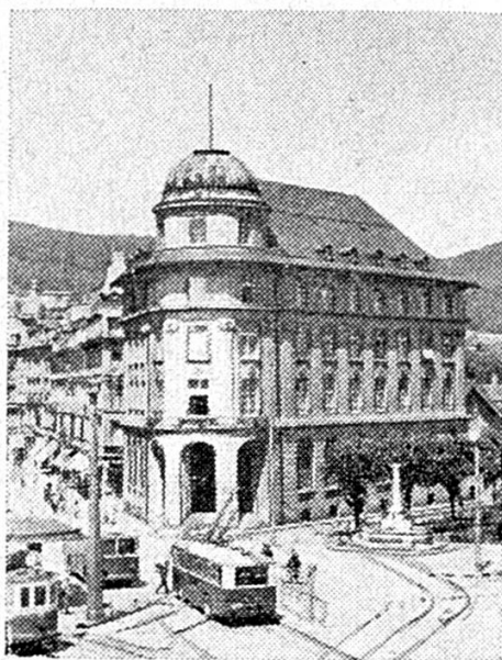
Hôtel de la Banque à Bienne