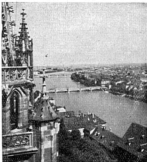
Le coude du Rhin