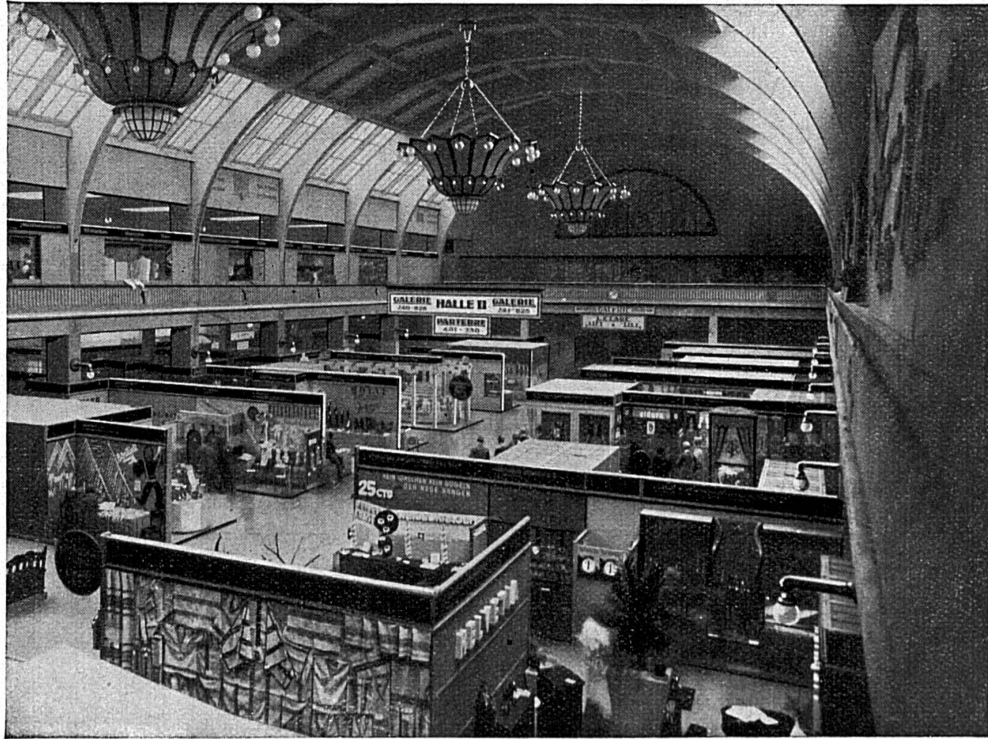
Halle II. Textile