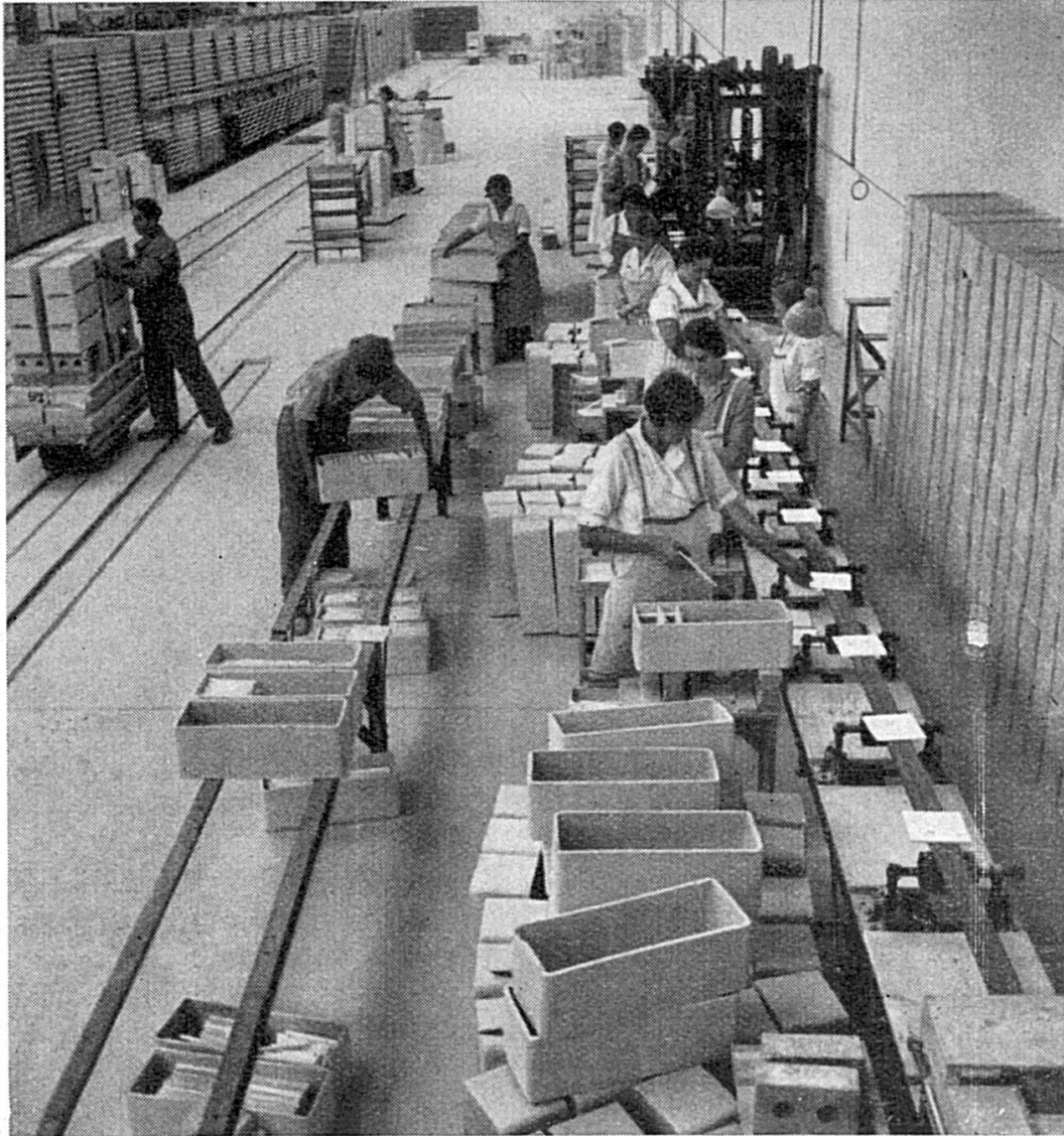
Emaillage des planelles. A gauche, le four-tunnel électrique. Glasieren der Wandplatten. Links, der elektr. Tunnelofen.

C'est en 1925 que fut fondée la S. A. pour l'industrie céra-