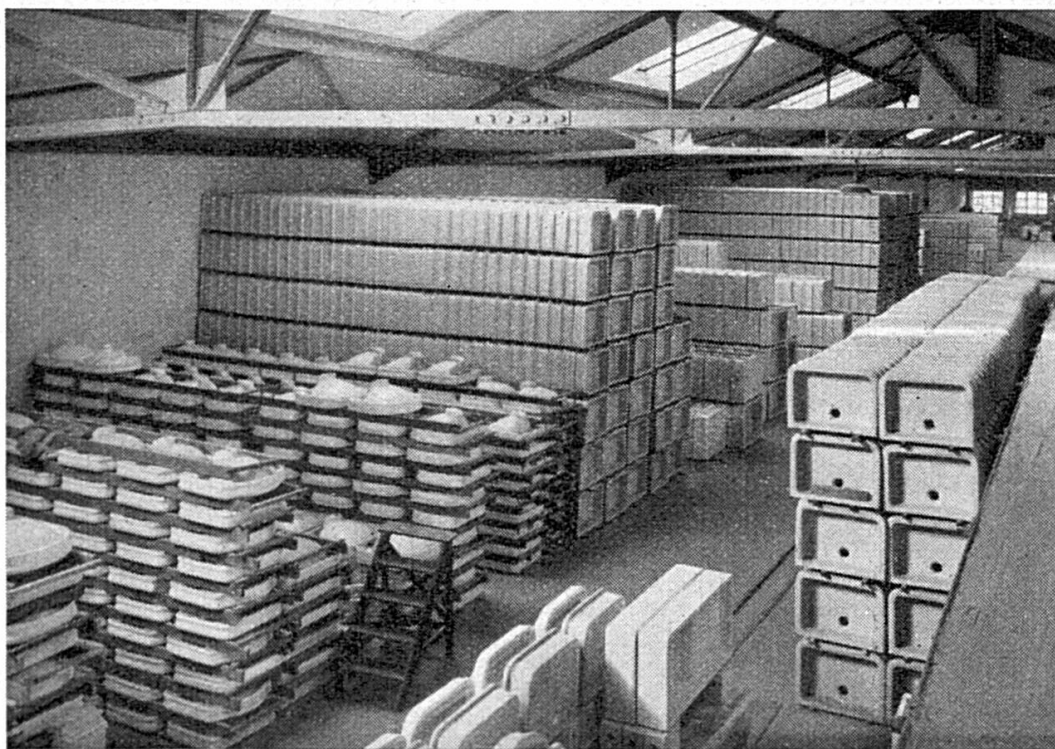
Vue partielle du magasin d'articles sanitaires. Teilansicht des Magazins sanit. Spüllwaren.

La fabrique de céramique produit en ce moment les articles les plus divers et les plus variés quant aux formes et aux couleurs. Elle se place de ce fait au centre de l'industrie céramique suisse. Elle est à la tête aussi des perfectionnements techniques de la fabrication et dans ce domaine elle a fait réaliser des progrès considérables à l'industrie céramique du monde entier, grâce à l'initiative et au courage de ses chefs. Elle a servi de champ d'expérience pour la mise au point de nouveaux procédés de cuis-