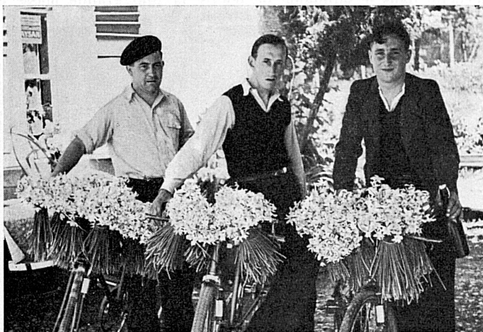
Le pillage des champs de narcisses de Damvant: Après la victoire !

Ces faits, chaque année renouvelés, nous ont engagés à demander la mise sous protection des champs de narcisses de Damvant. N'importe quel paysan de la contrée vous dira que les