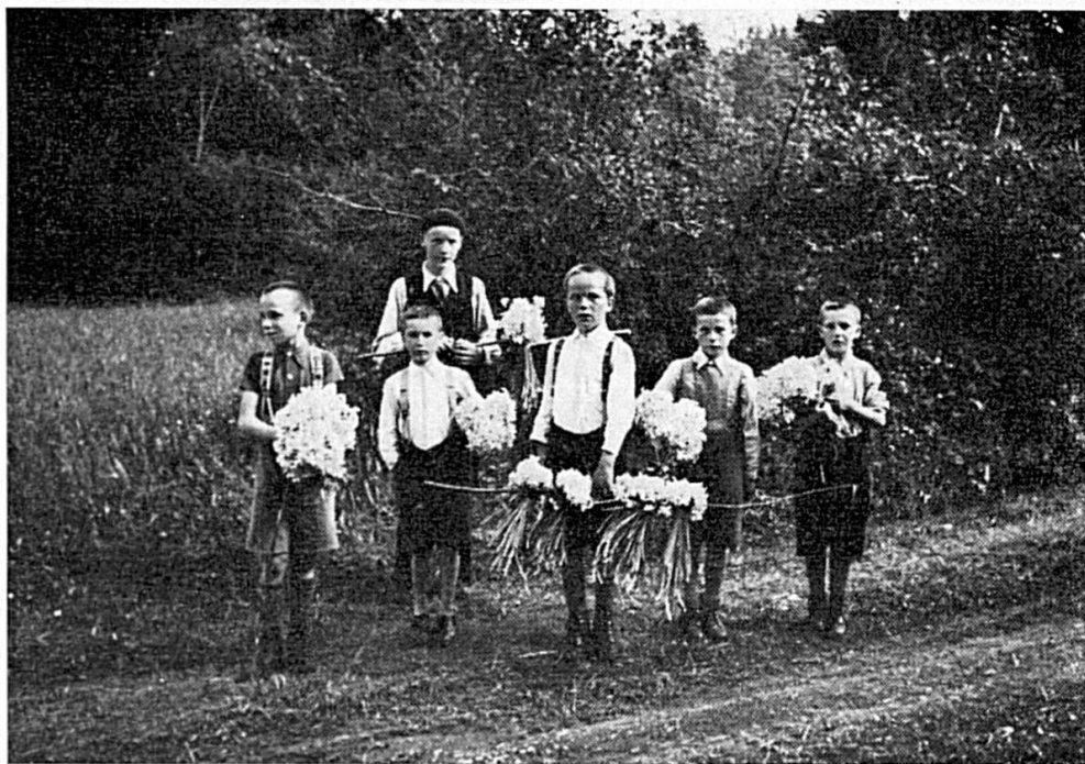
Le pillage des champs de narcisses de Damvant : Les fautifs sont ceux qui ne les éduquent pas

Nous avons vu maintes fois le spectacle sur les champs mêmes, le spectacle de la course aux fleurs, les jours de grande affluence. Des personnes de tous âges s'abattent, avides, sur ces prés parfumés et rivalisent de zèle dans la razzia. C'est à qui ramènera, dans le minimum de temps, la plus grande masse de