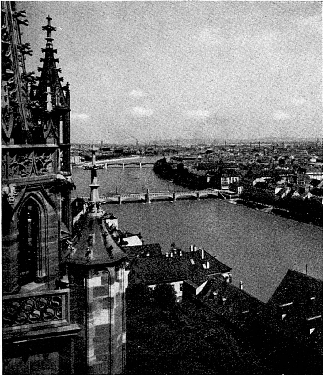
Coude du Rhin à Bâle vu des tours de la cathédrale

d'échantillons. Au cours de la grande guerre et dans les années qui suivirent, plusieurs Etats d'Europe organisèrent des foires d'échantillons modelées sur Leipzig. Cette éclosion de manifestations économiques fut tout particulièrement remarquable dans les bastions à forte tradition commerciale où œuvrent des populations à l'esprit entreprenant. L'idée de ce genre de foires se révéla aussitôt comme un principe animateur de l'économie. C'est aussi malheureusement la raison pour laquelle on vit naître des foires là où manquaient des bases économiques solides. La raison et une saine notion des nécessités économiques l'ont finalement emporté dans la lutte contre de telles entreprises hasardeuses.