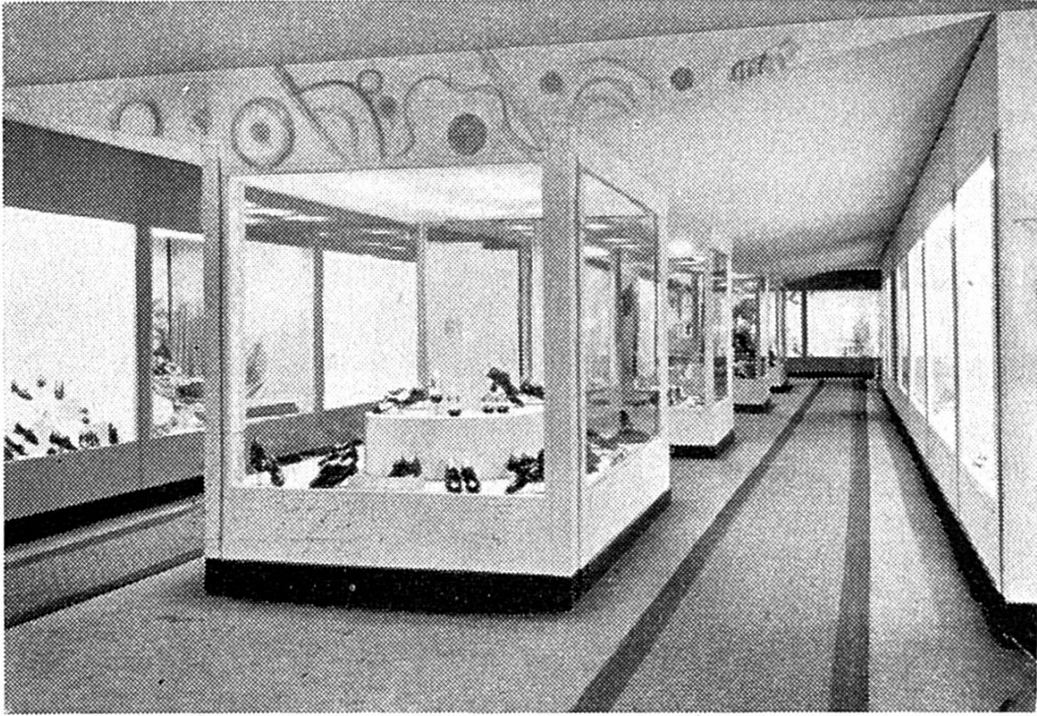
Halle II. — Galerie de la chaussure

plein cintre de 17 m. de hauteur au point culminant, de deux vaisseaux latéraux et de deux galeries latérales. Cette halle se prête avantageusement à l'organisation de festivités et concerts ; dans ces occasions, 6000 personnes peuvent y trouver place. Pendant la Foire, la halle II est occupée par les groupes de l'Industrie textile, vêtements et fournitures ; chaussures et articles en cuir ; Salon de la