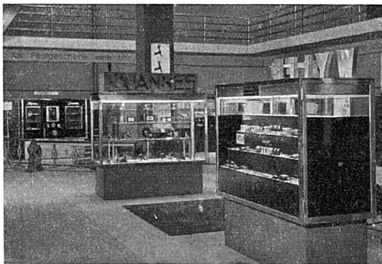
La Foire de l'horlogerie

Le bâtiment principal est le premier de l'ensemble ; on y pénètre par sept grandes portes qui donnent accès au vestibule d'entrée. De spacieux escaliers de marbre conduisent de là aux salles de fêtes de la Foire. Dans le bâtiment principal se trouvent également les bureaux de la Direction, de nombreuses salles de conférences, des bureaux et magasins, puis, à gauche des portes d'entrée, le grand restaurant ; l'aile droite contient le bureau des postes, téléphone et télégraphe. Le vestibule d'entrée conduit à la