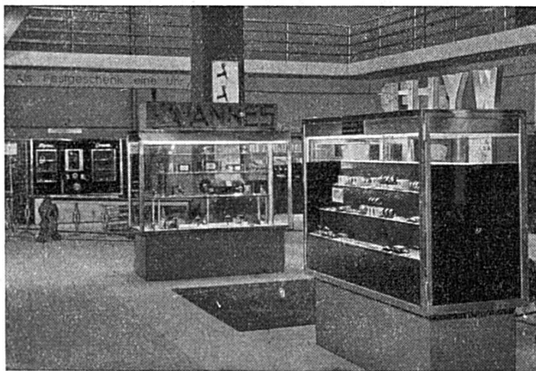
La Foire de l'horlogerie

Le bâtiment principal est le premier de l'ensemble ; on y pénètre par sept grandes portes qui donnent accès au vestibule d'entrée. De spacieux escaliers de marbre conduisent de là aux salles de fêtes de la Foire. Dans le bâtiment principal se trouvent également les bureaux de la Direction, de nombreuses salles de conférences, des bureaux et magasins, puis, à gauche des portes d'entrée, le grand restaurant ; l'aile droite contient le bureau des postes, téléphone et télégraphe. Le vestibule d'entrée conduit à la