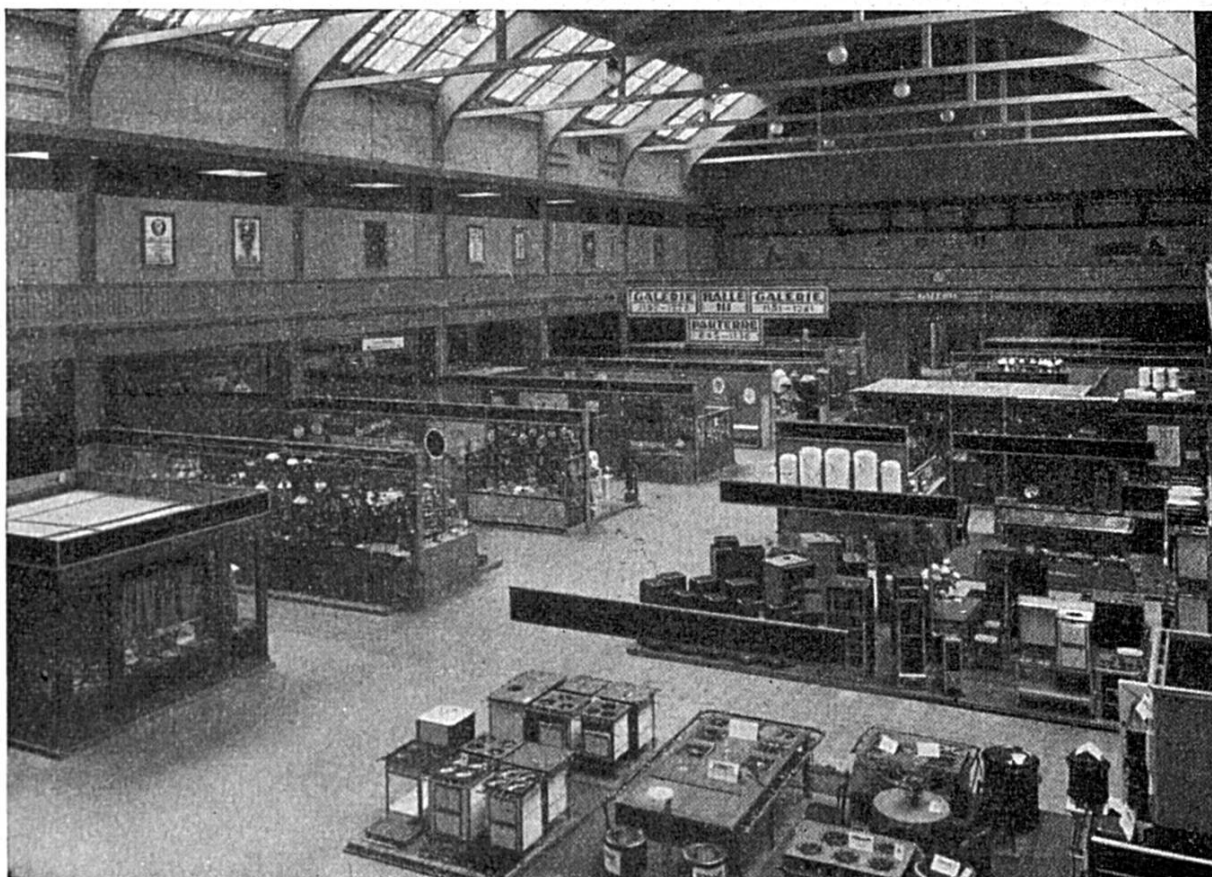
Vue de la Halle III

est une construction démontable le long de la halle VI qui fut édiflée pour la première fois en 1935. Elle abrite les machines pour le travail du bois, que l'on peut y voir en activité.