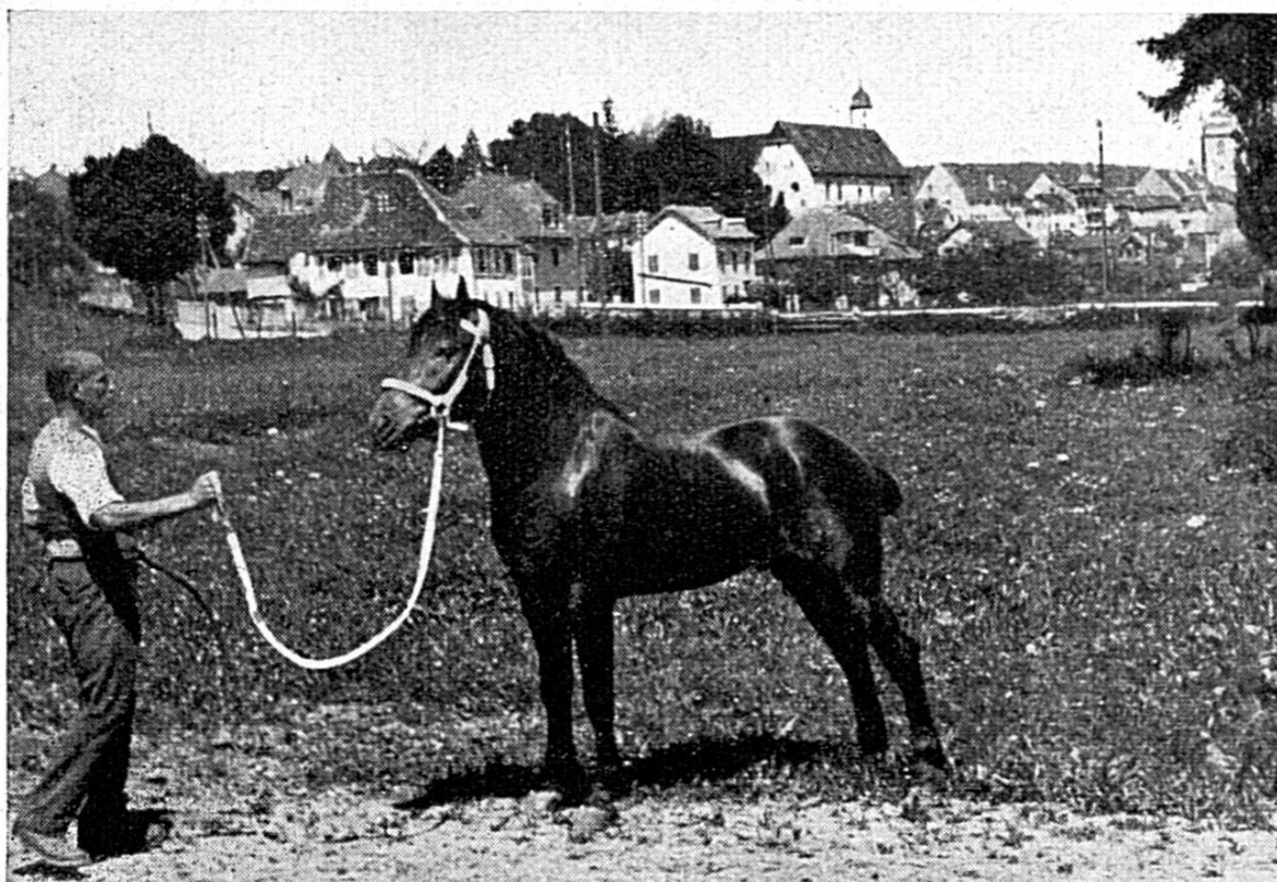
Bivouac , étalon de 3 ans, par Signal et Orange , aux frères Nussbaumer, Porrentruy