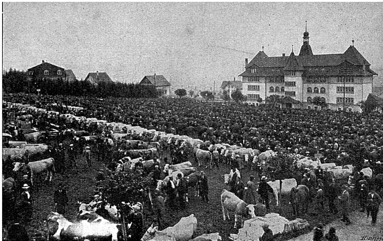
Une vue de la Foire de Chindon