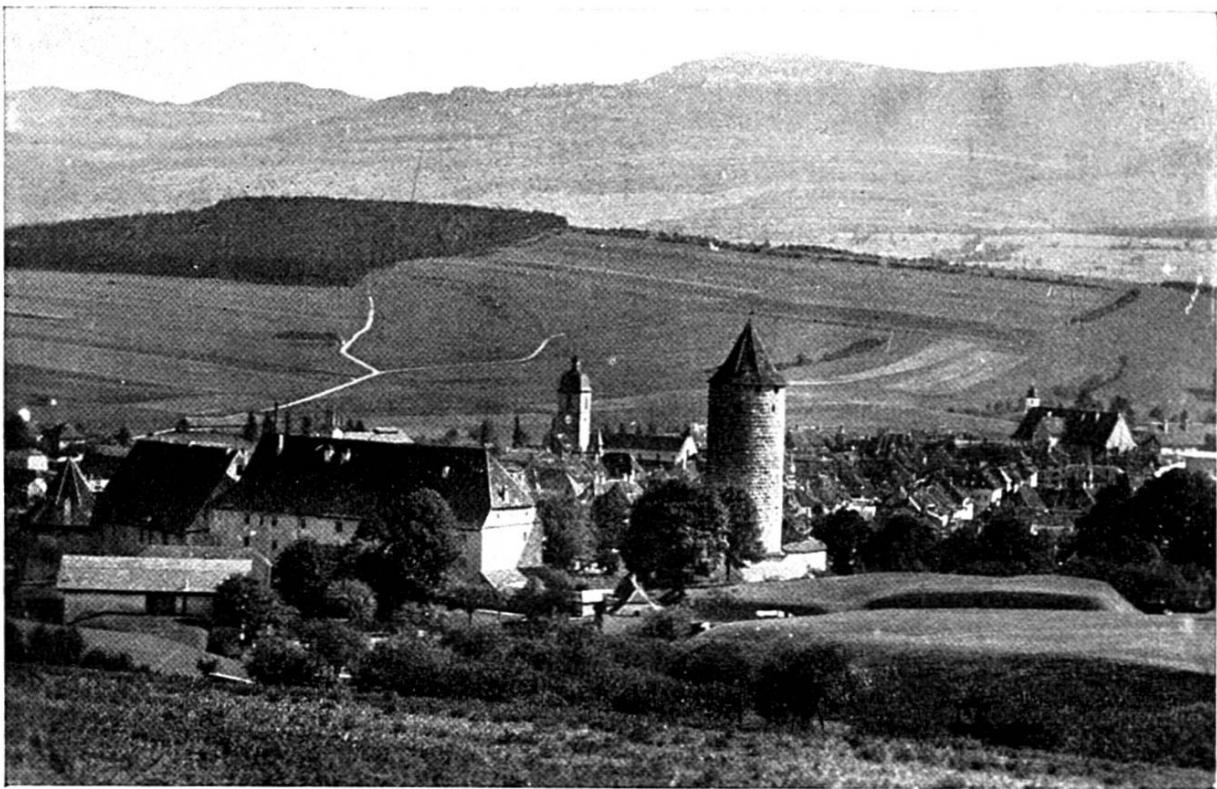
PORRENTRUY Vue générale