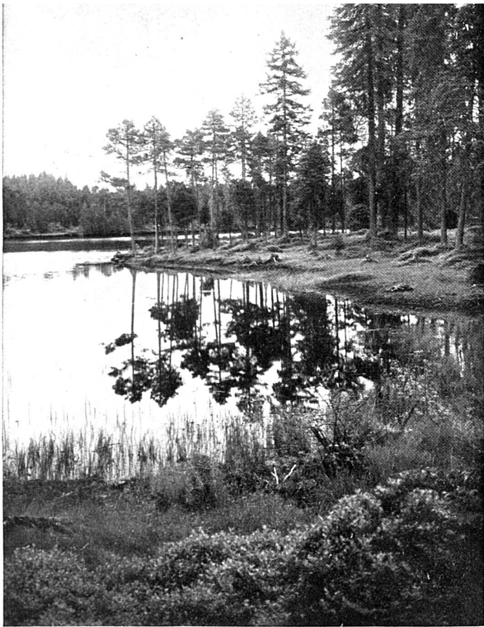
L'ÉTANG DE LA GRUYÈRE à proximité de la route de Tramelan à Saignelégier