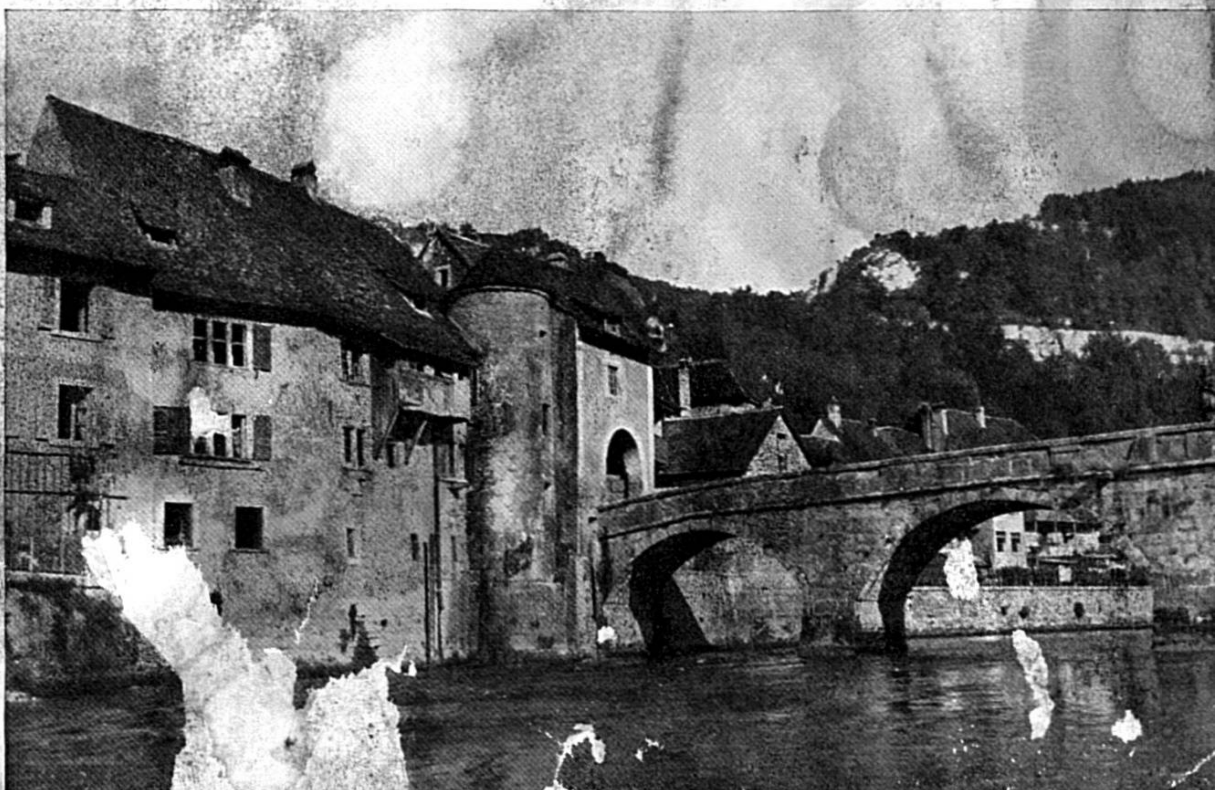
-UF ANNE e Doubs