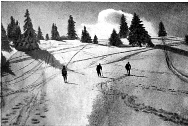
Piste de ski de l'Obergrenchenberg