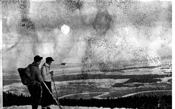
Vue depuis l'Untergrenchenberg sur la vallée de l'Aar et le plateau suisse