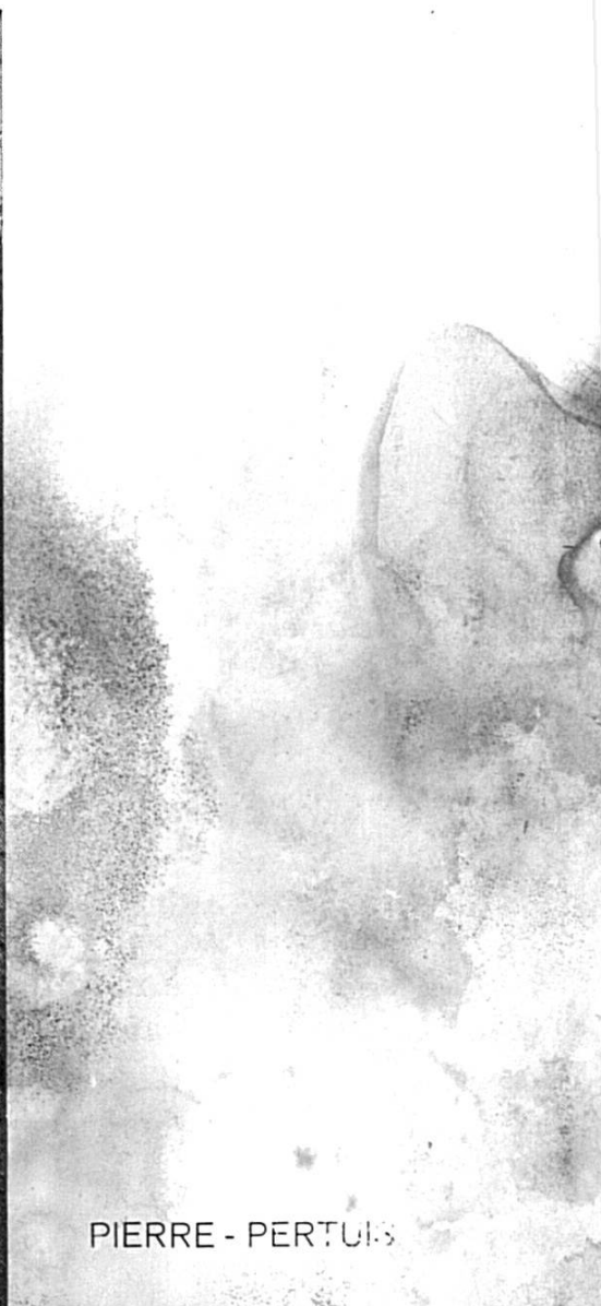
PIERRE - PERTUIS