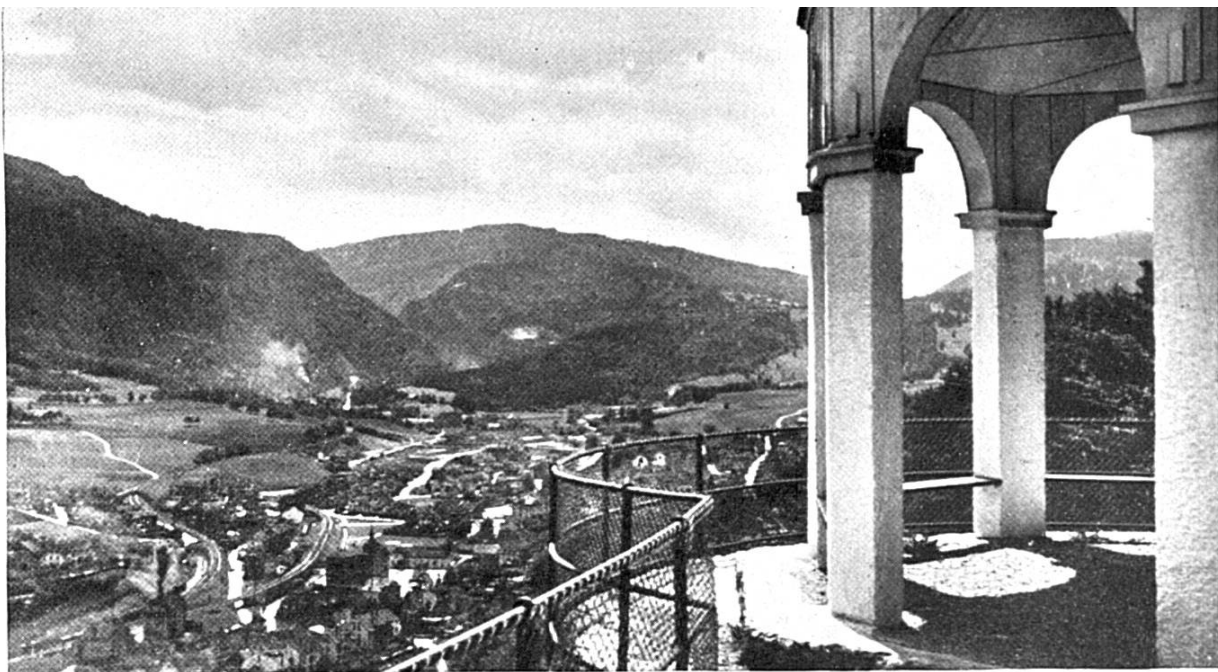
MOUTIER vue du pavillon