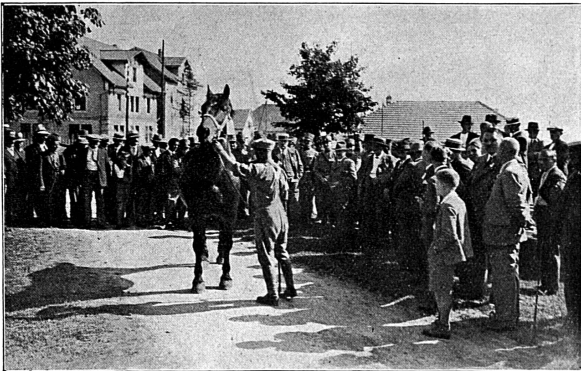
Le Marché-Concours de Saignelégier : Présentation des chevaux

Cette négligence eut naturellement son influence sur l'élevage du cheval qui, cependant, est une branche intéressante de notre économie nationale. Le Jura, comme les statistiques le prouvent, fournit à lui seul, plus de la moitié du cheptel chevalin