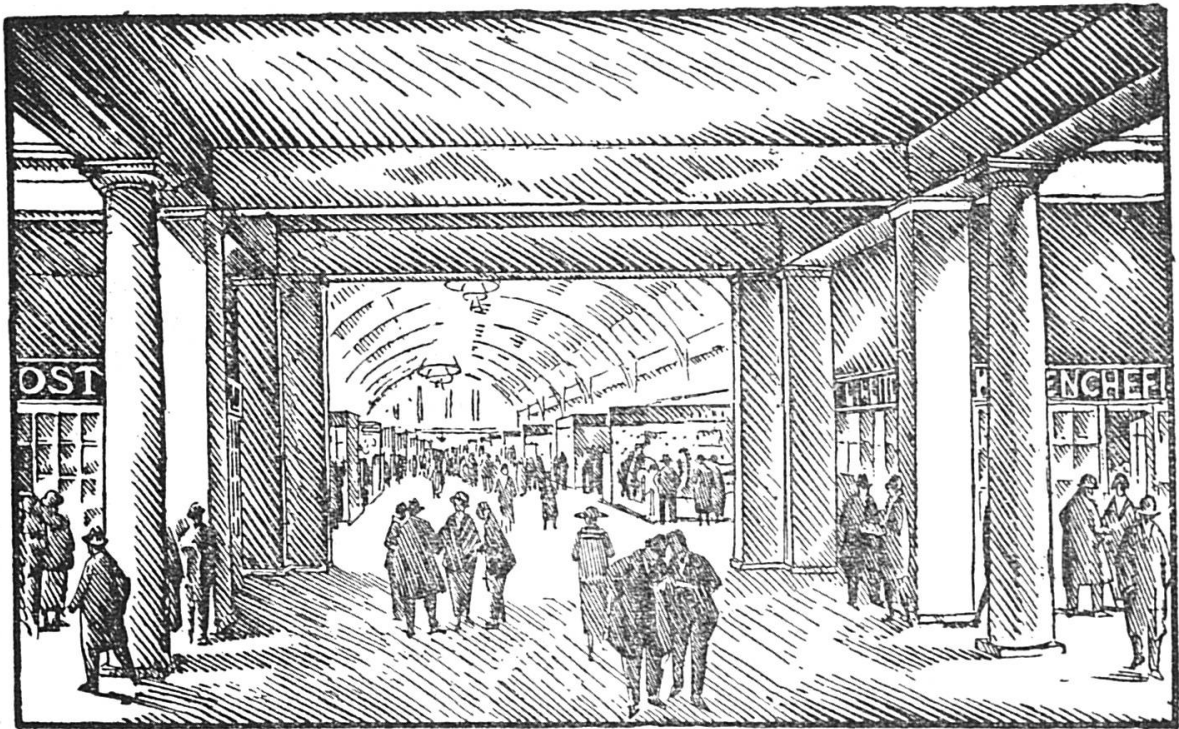
Bâle, Foire suisse d'Echantillons, grand hall