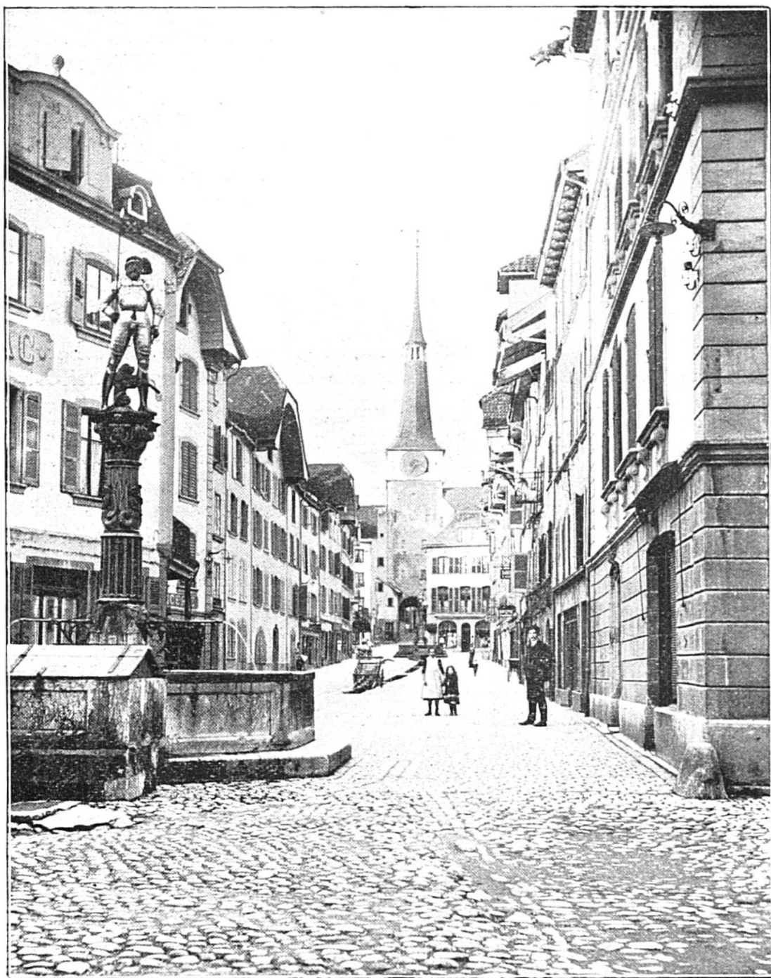
Neuveville : rue du Marché