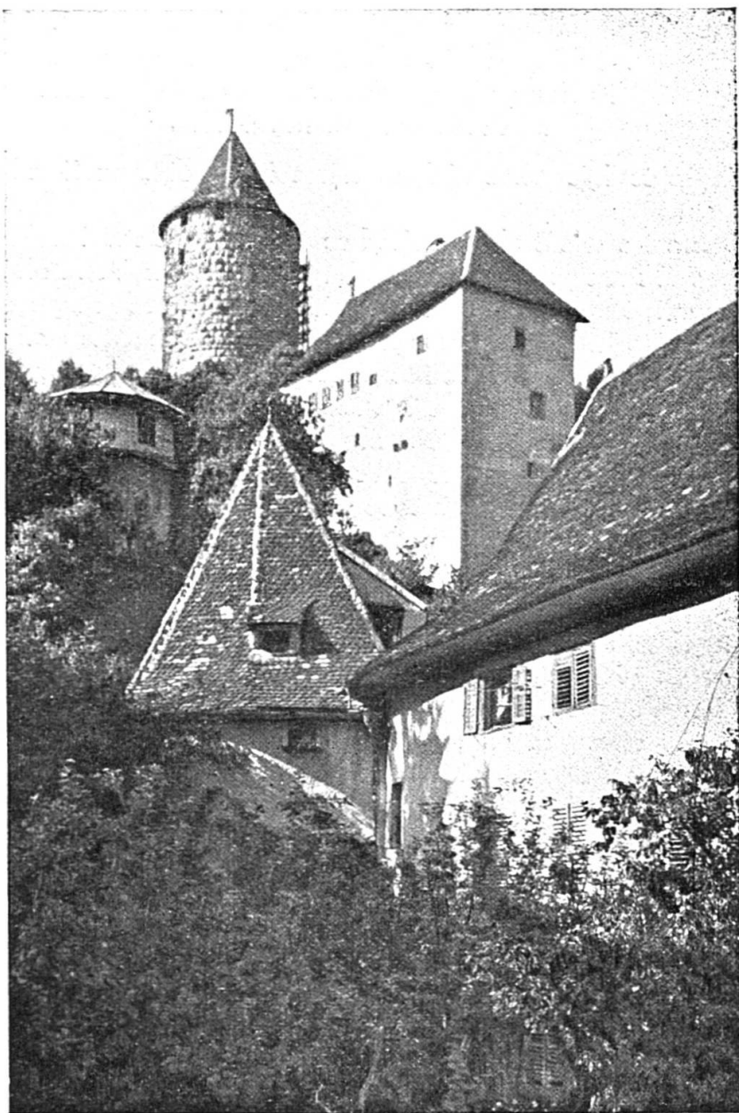
Porrentruy : la tour Réfouss