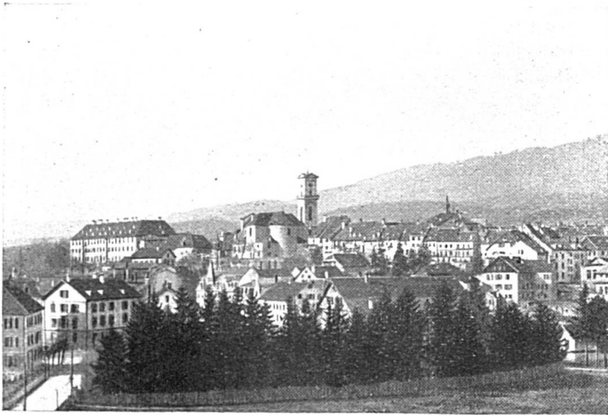
Delémont : vue générale