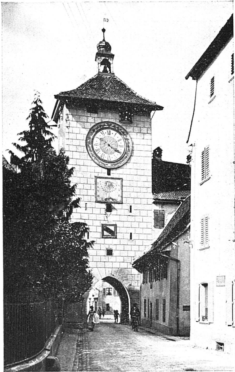
Laufen : la porte de Berne