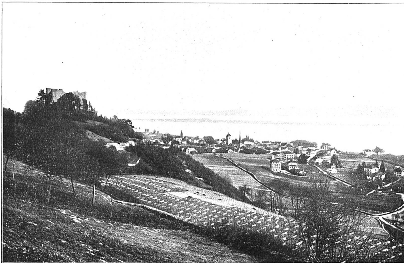
Neuveville : le lac de Bière