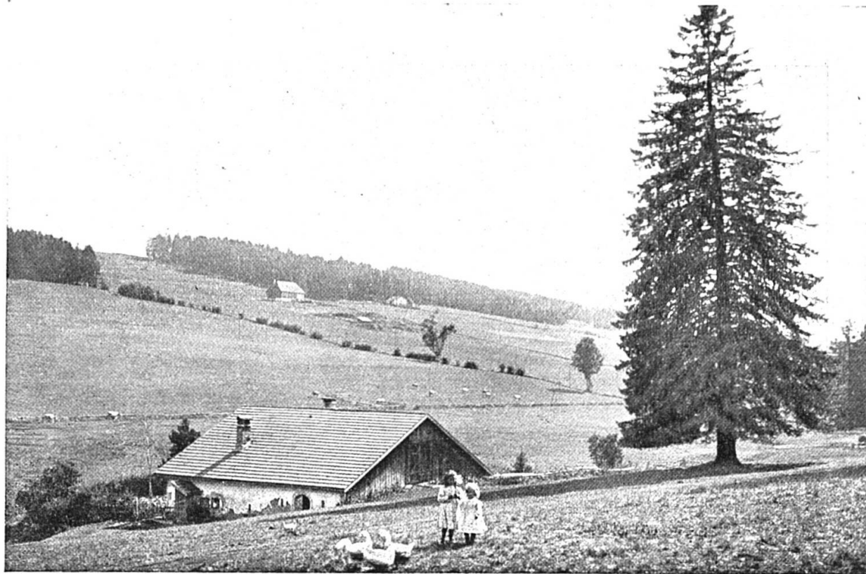
Un pâturage des Franches-Montagnes