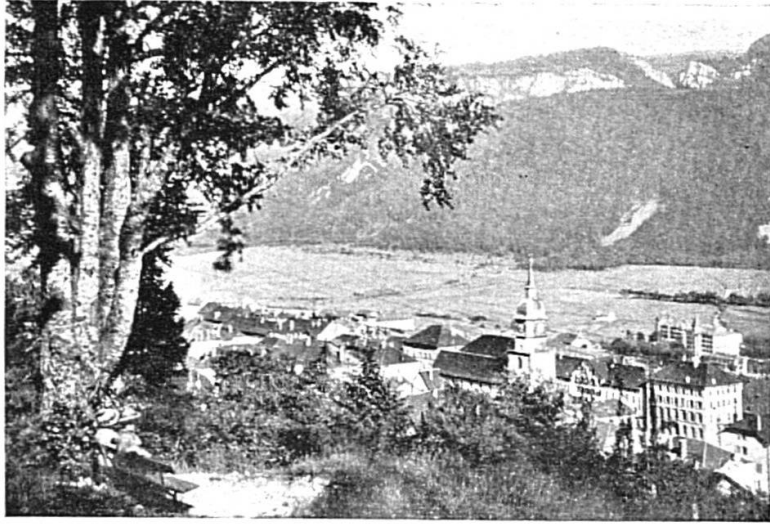
St-Imier : vue générale