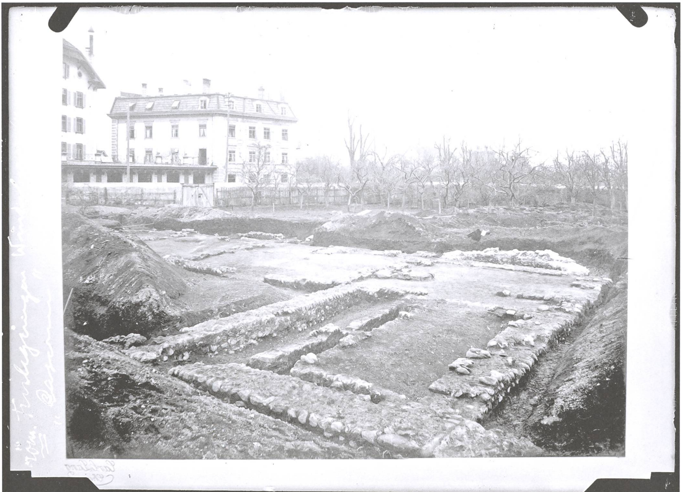
Abb. 1: Chur, Areal Custorei. 1902. Die erste Ausgrabung in Graubünden. Spiegelverkehrte Abbildung mit einer auf der Glasplatte angebrachten Notiz.

1902 wurde im Auftrag der Historisch-Antiquarischen Gesellschaft auf dem Areal der Custorei im Churer Welschdörfli die erste