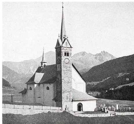
Abb. 96: Tujetsch, Sedrun, Kirche S. Vigeli. Blick gegen Osten. Zustand um 1940.

Wohl 1805 wurde die Westempore über dem Hauptportal errichtet, als Silvester Walpen unter Verwendung von Teilen der Chororgel des 18. Jahrhunderts ein neues