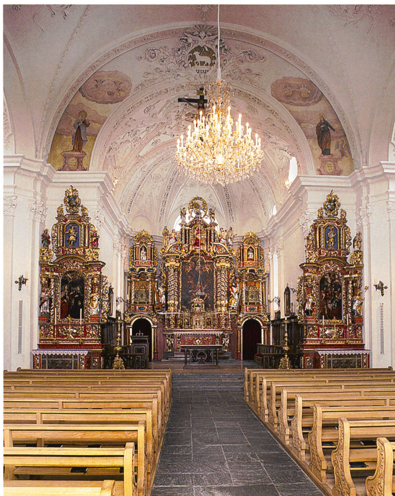
Abb. 97: Tujetsch, Sedrun, Kirche S. Vigeli. Blick Rich- tung Chor auf die Ritz'schen Barockaltäre. Nachzustand.