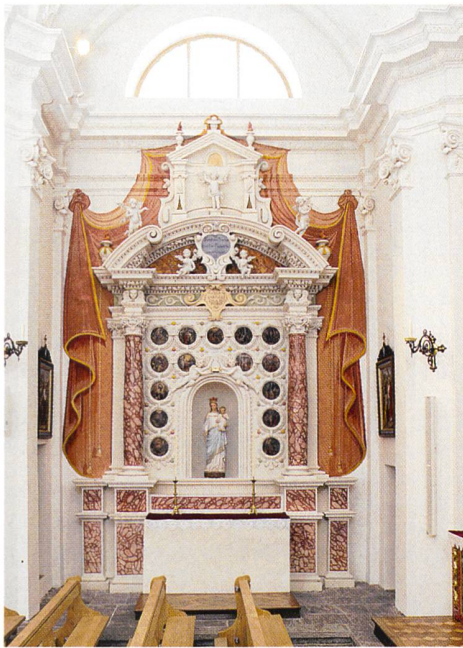
Abb. 104: Tujetsch, Sedrun, Kirche S. Vigeli. Der stuckierte Rosenkranzaltar in der Nordkapelle von 1691 (Muttergottesstatue von 1888/89). Nachzustand.