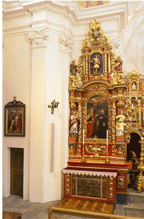
Abb. 103: Tujetsch, Sedrun, Kirche S. Vigeli. Der linke Chorschulteraltar aus der Zeit um 1725. Nachzustand.

Eine besonders aufwändige Freilegungs- und Restaurierungsarbeit erforderte der barocke Stuckaltar in der nördlichen Seitenkapelle von 1691 (Abb. 104). Das Zentrum des stuckierten Altaraufsatzes bildet eine mit profiliertem Rahmen gefasste Rundbogennische, die zur Aufnahme eines Muttergottesbildes bestimmt ist. Auf dem Rahmenrund sitzen zwei Putti, die eine (jüngere) goldene Holzkrone halten. Der Hintergrund zwischen Nischenrahmen und den beiden Säulen, die den Architrav und Segmentgiebel tragen, belegen 15 Stuckmedaillons in Blattrahmen mit Vierblattblüten in den Zwickeln. Die Medaillons zeigen je fünf Szenen des Freudenreichen, Glorreichen und Schmerzhafte Rosenkranzes. Diese Szenen sind mit Ölfarben auf runde, verzinnete Eisenbleche gemalt. Der ursprünglich weiss gefasste Stuckaltaraufsatz war im Giebelfeld, auf den Säulen