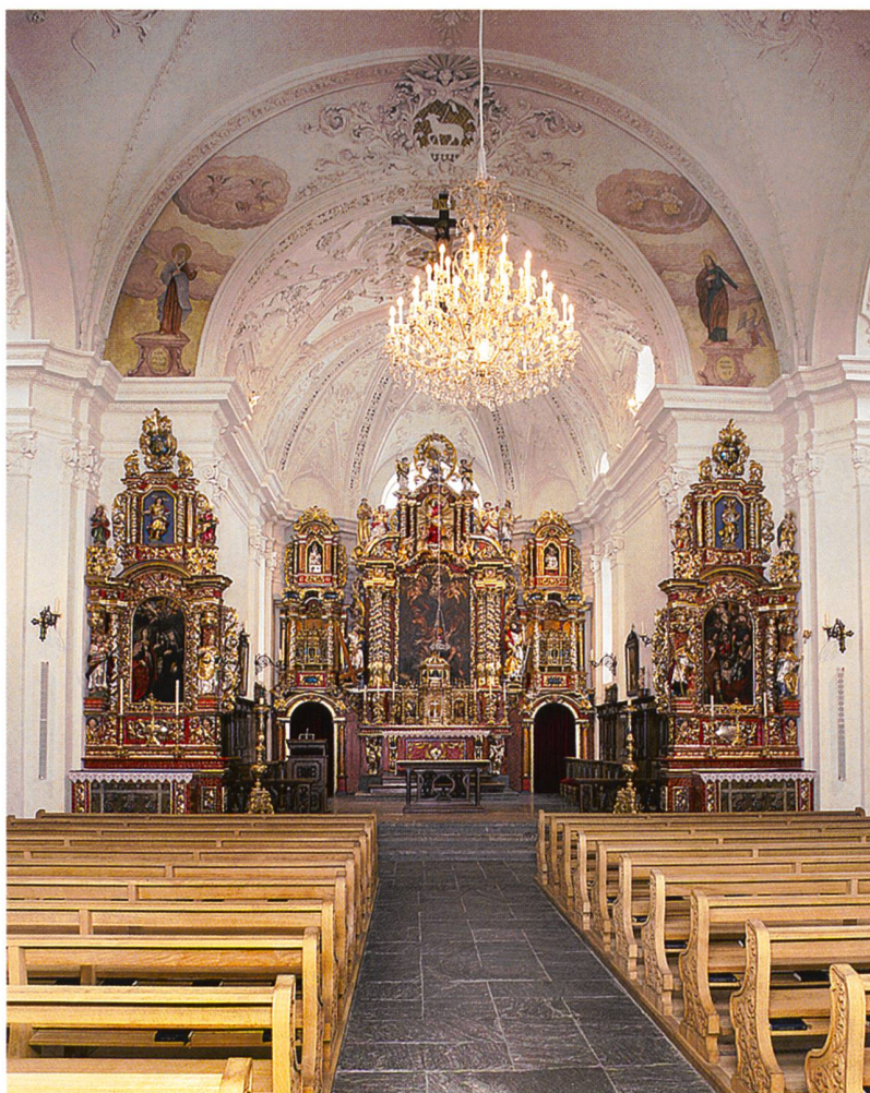
Abb. 97: Tujetsch, Sedrun, Kirche S. Vigeli. Blick Rich- tung Chor auf die Ritz'schen Barockaltäre. Nachzustand.

Instrument baute. In den Jahren 1888/89 erfolgte eine umfassende Renovation des Kircheninnern im Stile der Neurenaissance. Planer dieser Massnahmen war Domvikar Dengler aus Regensburg (D). Die Firma Gebr. Gross aus Stadtamhof-Regensburg lieferte eine neue Muttergottesstatue für den Rosenkranz-Altar, die von den Jungfrauen des Tujetsch bezahlt wurde. Auch die Chorstühle, die Beichtstühle und die Kanzel stammten wohl von dieser Firma. Der in Regensburg tätige Kunstmalers Deplaz aus Tujetsch, Selva, malte die