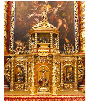
Abb. 102. Tujetsch, Sedrun, Kirche S. Vigeli. Der Tabernakel des Hochaltars von 1703. Nachzustand.