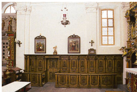
Abb. 100: Tujetsch, Sedrun, Kirche S. Vigeli. Blick Richtung Eingang. Nachzustand.

Abb. 99: Tujetsch, Sedrun, Kirche S. Vigeli. Blick auf die nördliche Chorwand, nach der Restaurierung. Rechts im Bild eines der erneuerten Fenster.