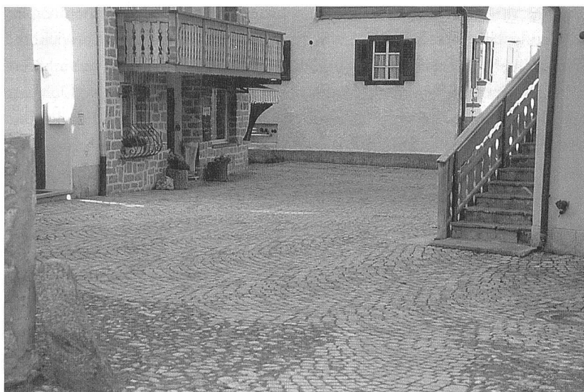
Abb. 174: Die Abbildung illustriert zwei Aspekte: einerseits, in welchem Masse die Minimallösung ›Oberflächen‹ von der Behandlung der Randbebauung des Platzes abhängig ist; andererseits, wie wichtig der Einbezug der angrenzenden Strassenräume ins Konzept ist. Im Falle dieser Neugestaltung eines Platzes in Bivio wurde der Übergang zur bestehenden Pflasterung über die Bogen der neuen Steine hergestellt. In einem kleinen Streifen führt die Würfelpflasterung weiter in die angrenzende Gasse.

fenden, zentnerschweren Blumentröge rauben dem Platz die Weite und/oder den Zusammenhang und verwischen die fein abgestufte Hierarchie der Dekoration, so dass es ab und zu scheint, als hätte jemand einen roten Farbtopf auf die zarten Farben eines sorgfältig nuancierten Aquarells gegossen. Massnahmen, die ‐kübelweise‐ Natur in die Siedlung tragen, scheinen Kompensationsakte zu sein; unbewusste Bemühungen, Ersatz für den gewachsenen Boden zu schaffen, der - durch homogenisierende Trennschichten wie Asphalt und Beton zugedeckt - wiederum unbewusst vermisst wird.