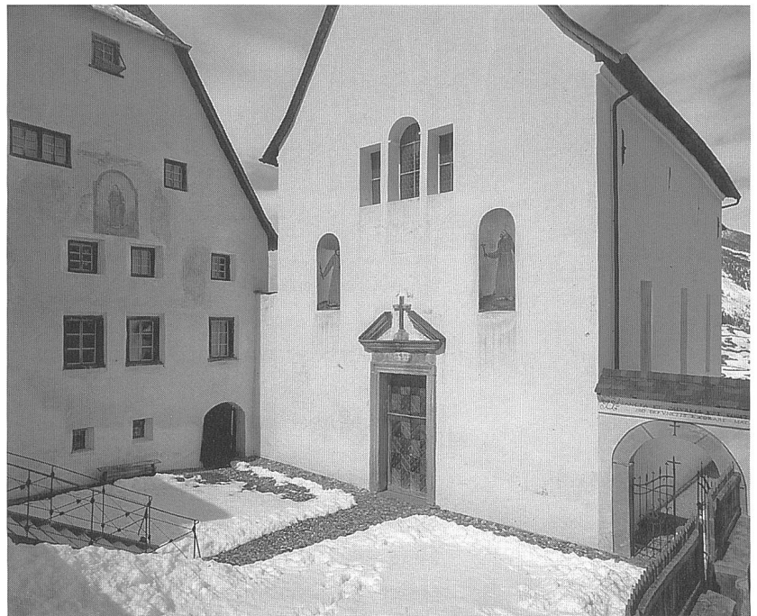
Abb. 169: Der Kirchenvorplatz in Mon ist ganz auf die Eingangsfasade der Pfarrkirche, eines barocken Baus des Misoxers Giulio Rigaja von 1648, ausgerichtet. Vor wenigen Jahren wurde das aus derselben Epoche stammende Pfarrhaus an der Nordseite restauriert und die Pflasterung instand gesetzt.

Der Bezug zum Boden bzw. zum Erdreich erscheint für die Authentizität eines Platzes auf den ersten Blick gering oder sogar vernachlässigbar. Es gibt aber eine Differenz zwischen einem Platz mit "Bodenkontakt" und einem solchen auf der Abdeckung eines Parkhauses, aber auch zwischen einer in Sand und einer in Zementmörtel gesetzten