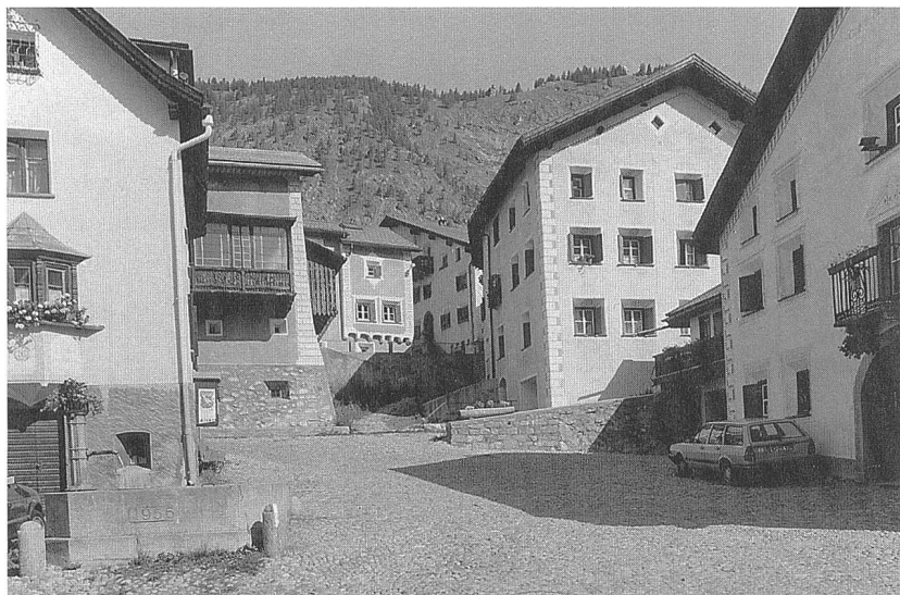
Abb. 173: Ausschnitt des Platzes von Bügl suot in S-chanf im Engadin, das seit 1984 vom Durchgangsverkehr befreit ist. Typische Merkmale: die erhaltene, historische Bollenpflasterung, der Brunnen und die Orientierung der Stufenfenster sämtlicher Wohnbauten auf den Platz hin.

blieben ihm. Der Platz verlor so seine Multifunktionalität.