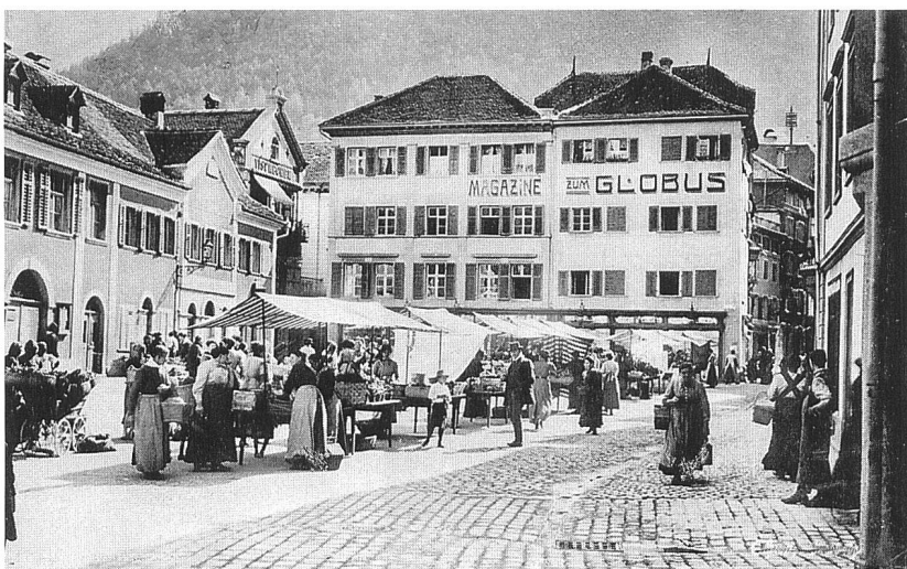
Abb. 168: Der Kornplatz in Chur in seiner Funktion als Marktplatz um 1920. Entlang der südlichen Bebauung eine Fahrbahn mit unterschiedlichen Pflästerungen. Die 1827/28 erbauten städtischen Wachtstuben links und das Kaufhaus im Hintergrund deuten auf eine gewisse Zentrumsfunktion hin.

Denkmalpflegerisch relevante Elemente historischer Plätze sind deren Boden, ihre Möblierung, die in der Regel sehr zurück-