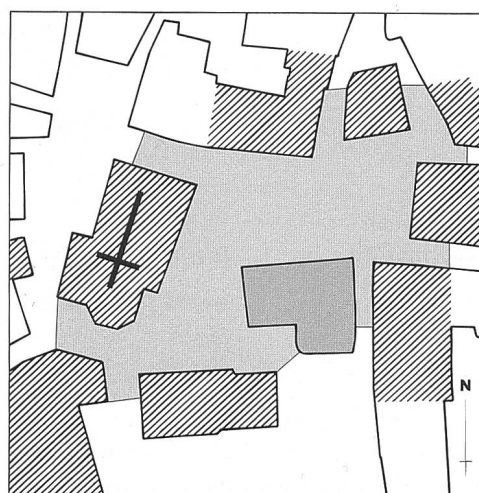
▨ Durch Denkmalpflege begleitet ■ Begleitung vorgesehen

Ein sehr gutes Resultat wird erreicht, wenn sowohl die Platzoberfläche als auch die angrenzenden Bauten - möglichst vollständig - nach denkmalpflegerischen Grundsätzen erhalten werden (Abb. 175) 96 . Das Ergebnis ist ein authentisches, uneinheitlich-einheitliches Bild, bei dem neben dem Auge auch das Ohr und der Tastsinn auf ihre Rechnung kommen.