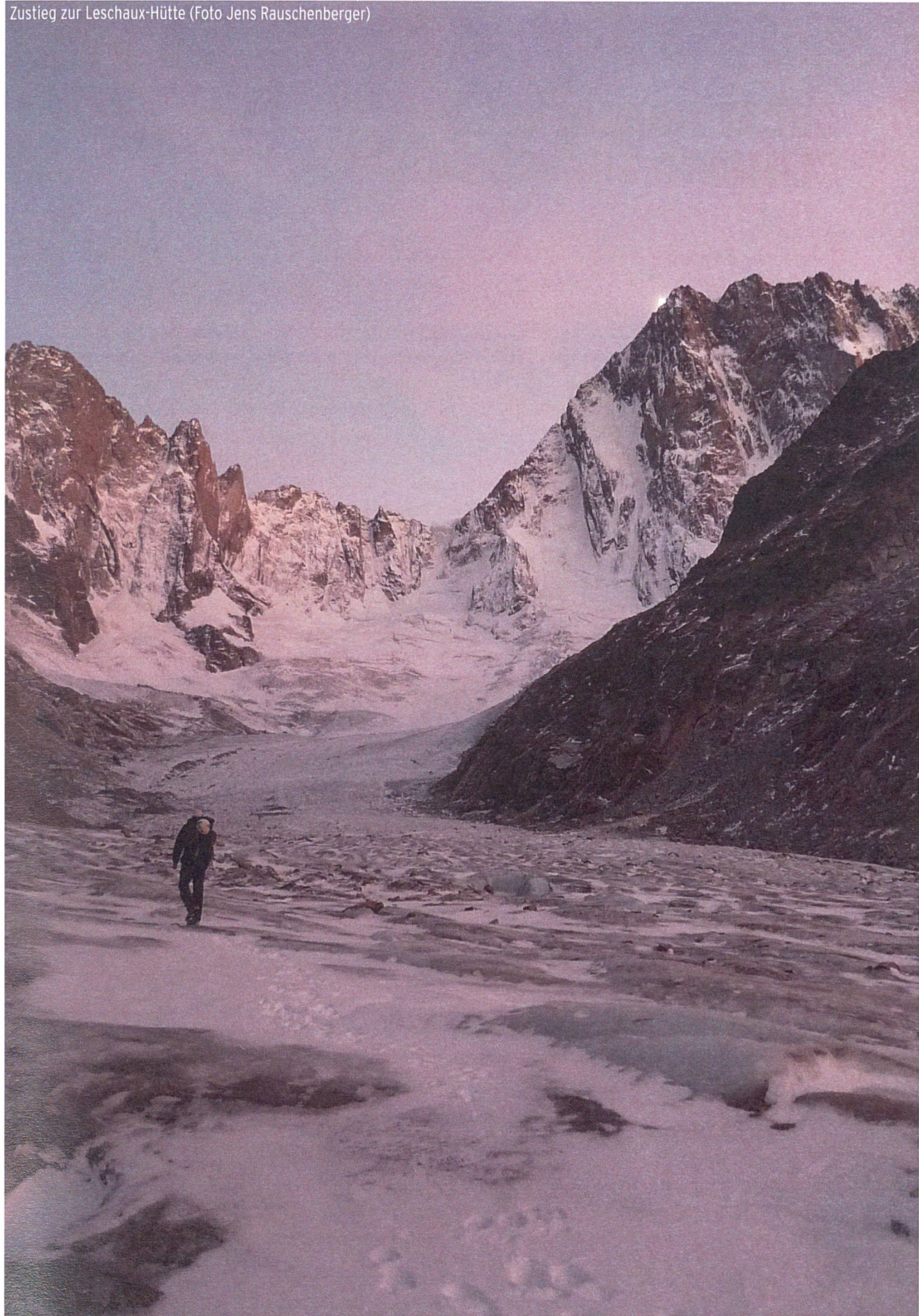
Zustieg zur Leschaux-Hütte