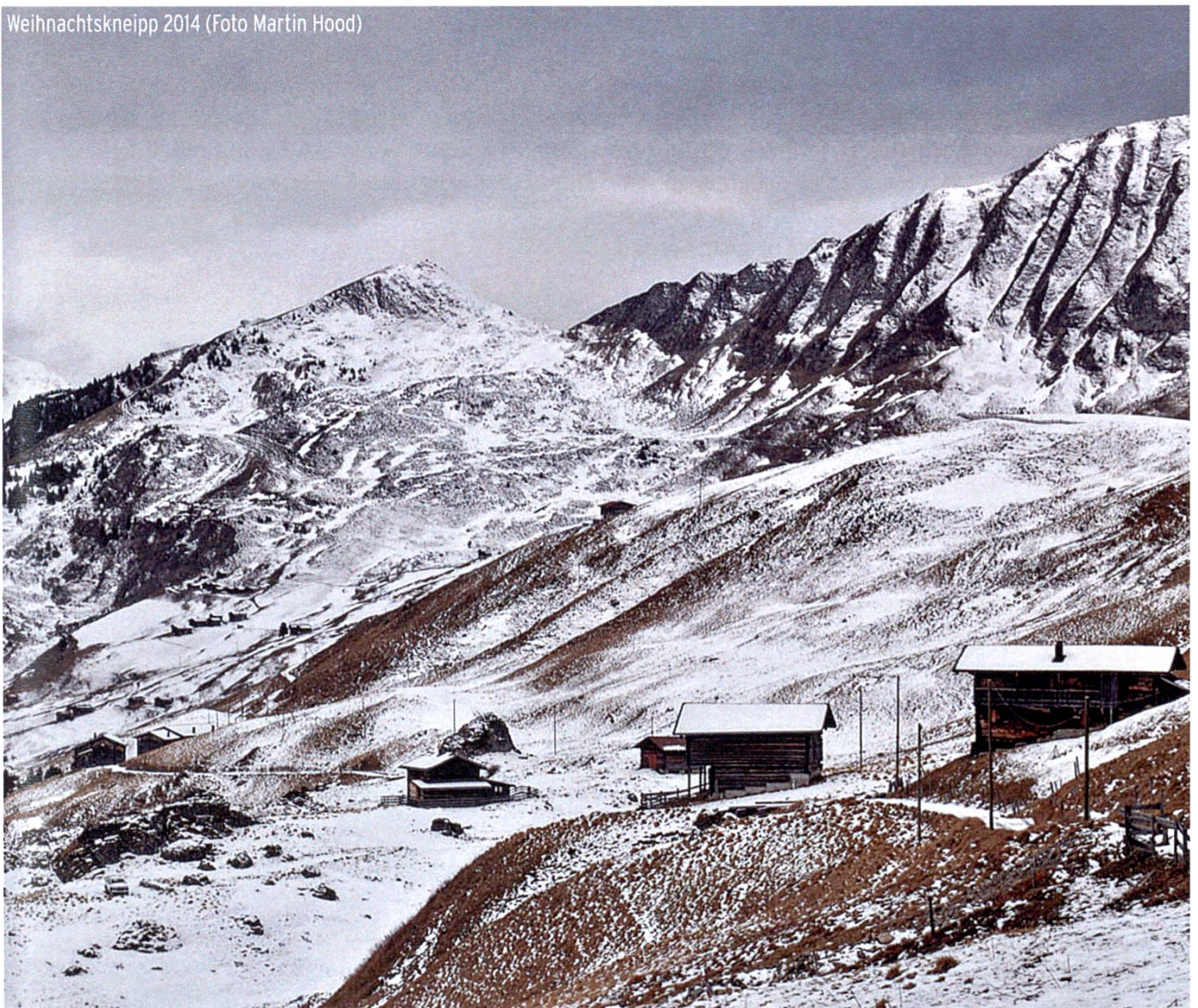
Weihnachtskneipp 2014