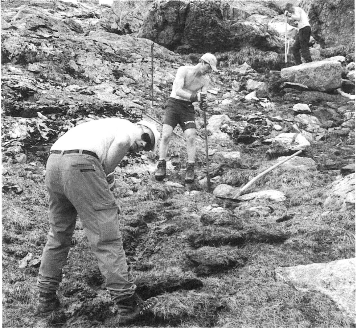
Aktive bei der harten Aushubarbeit für die neue Wasserleitung.

wieder für Fronarbeiten zusammen; sie schaufelten Schnee, rissen den Altbau ein, räumten immer wieder auf und verlegten die 700m lange Druckleitung für die Mikroturbine. Handwerker und Hüttenwarte jedenfalls staunten über so viel Zupacken.