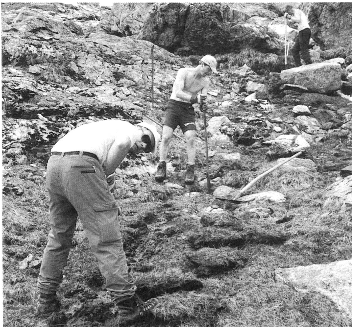
Aktive bei der harten Aushubarbeit für die neue Wasserleitung.

wieder für Fronarbeiten zusammen; sie schaufelten Schnee, rissen den Altbau ein, räumten immer wieder auf und verlegten die 700m lange Druckleitung für die Mikroturbine. Handwerker und Hüttenwarte jedenfalls staunten über so viel Zupacken.