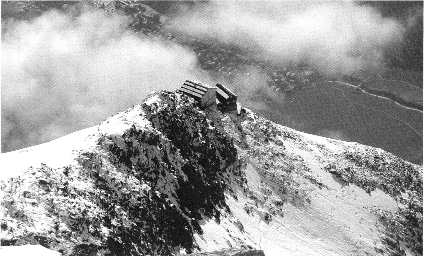
Der «Adlerhorst»: Blick vom Steinmannli auf die Mischabelhütten und Saas Fee.