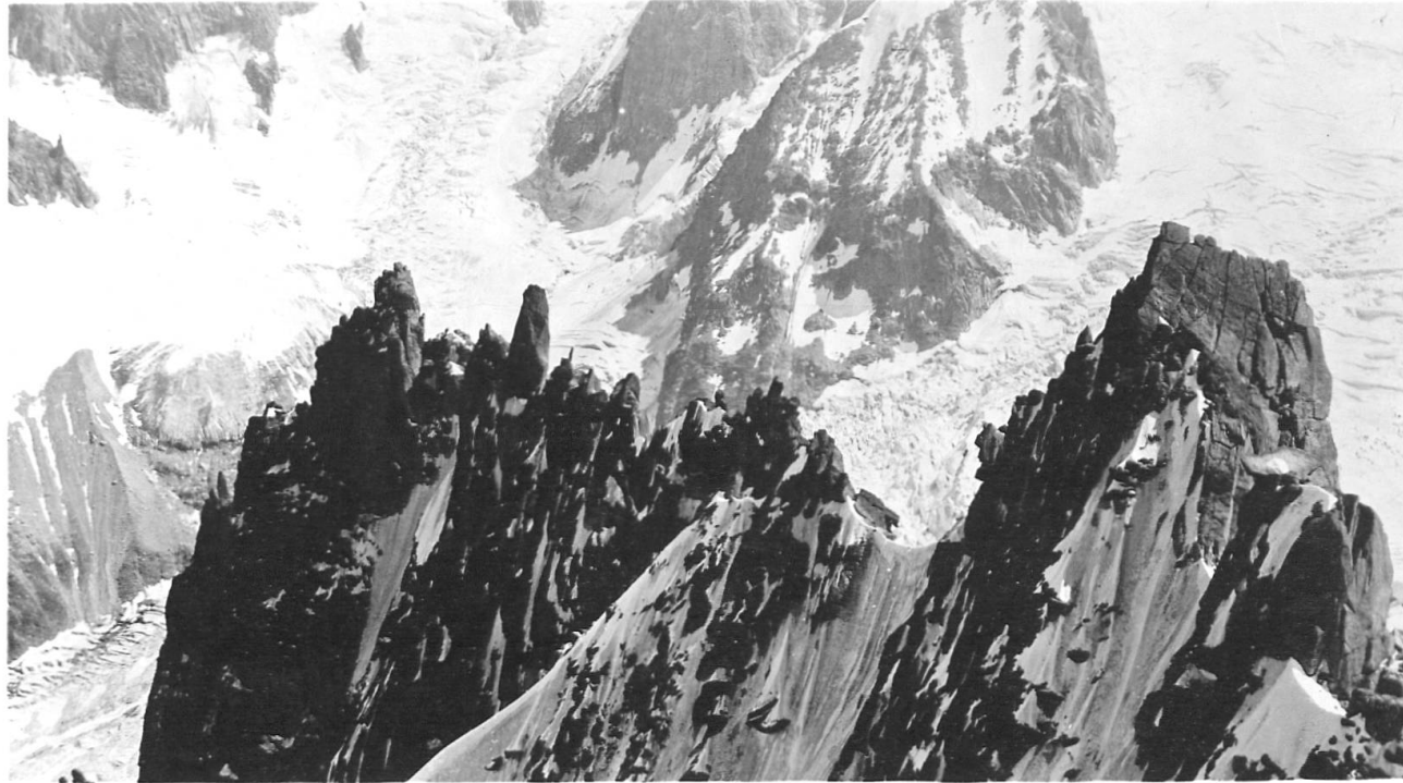
Pain de Sucre, Dt. du Requin von Aiguille du Plan