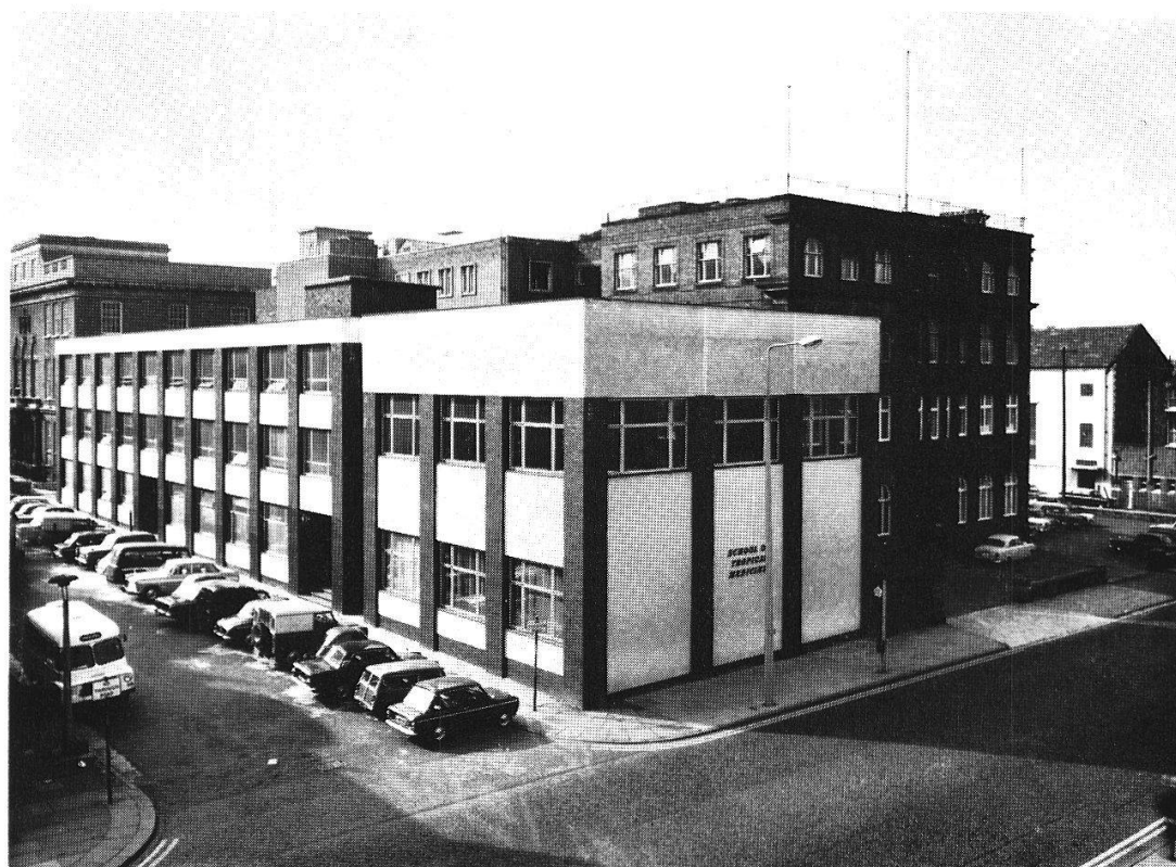
Fig. 2. Les nouveaux bâtiments de l'Ecole de Liverpool, inaugurés en 1966.