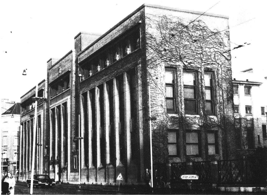
L'Institut à Anvers.