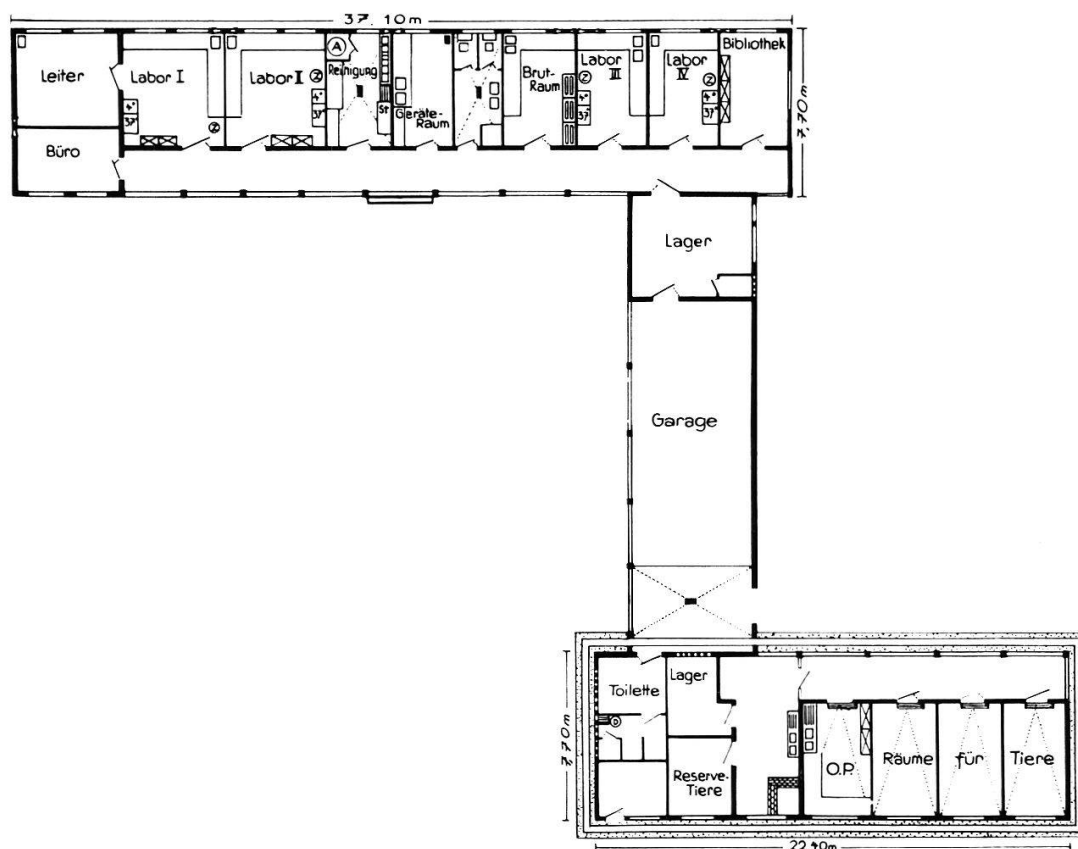
Fig. 2. La Station de recherche au Libéria de l'Institut de maladies maritimes et tropicales « Bernhard-Nocht ». Vue du projet des bâtiments de laboratoires, de l'animaleraie et du garage.

route secondaire principale (env. 32 km). La durée du trajet en auto est d'une heure et demie.