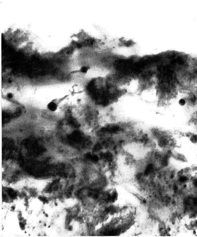
Abb. 1. Leptospiren in der Darmwand von Ornithodoros moubata am 10. Infektionstag.