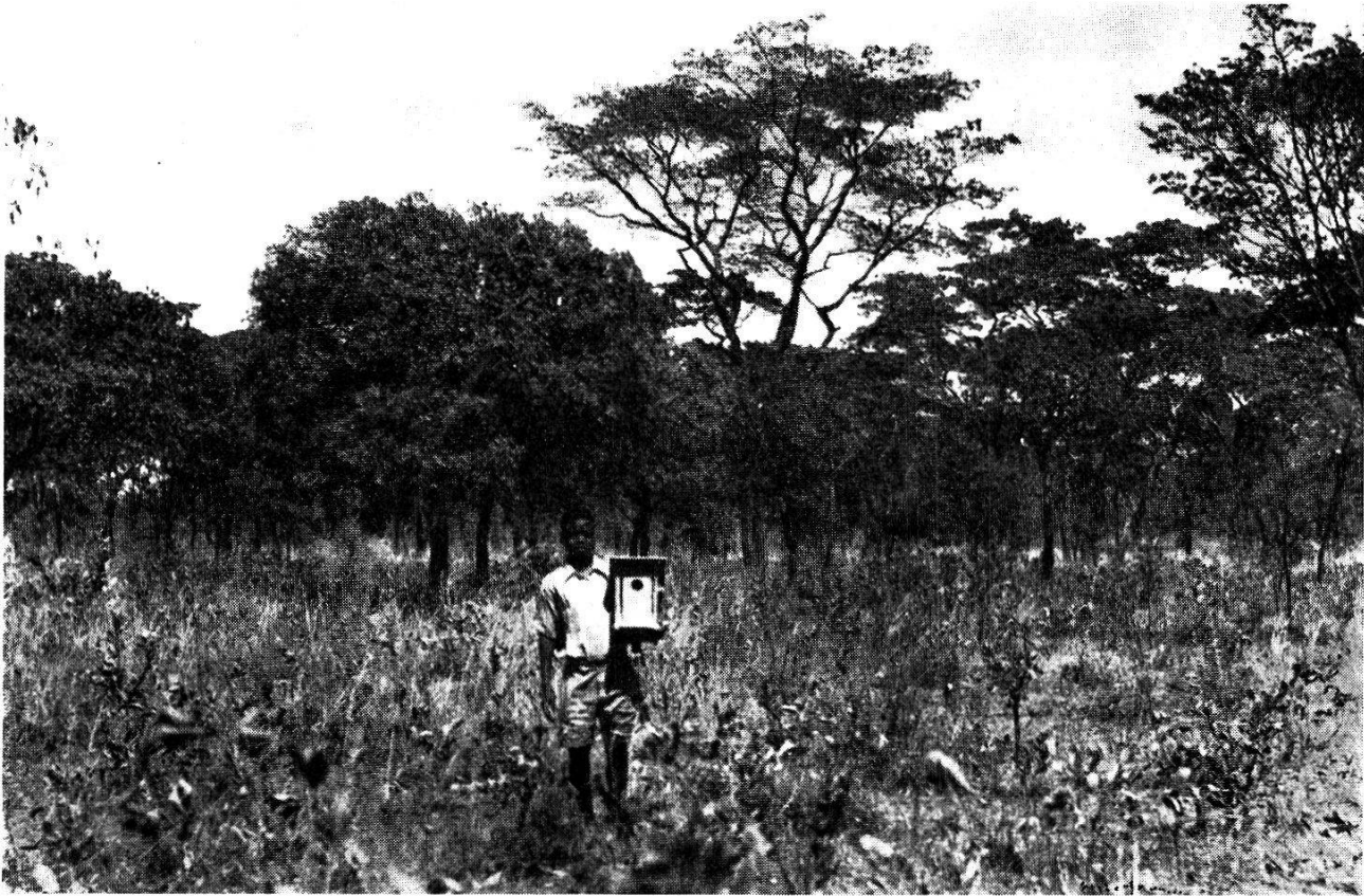
Abb. 2. Teilansicht des Busches im Versuchsgebiet am Tage des Nistkastenaufhängens (3. September 1950), also ca. 1\frac{1}{2} Monate vor Beginn der Regenzeit. Man beachte das dichte Laubwerk. Im Vordergrund durch Weidegang und Holznutzung gestörter Wuchs, im Hintergrund sozusagen normaler Baumwuchs.

Brachystegia randii machte ungefähr 90% aller Bäume aus, die eine Höhe bis zu 10 Meter erreichten. Uapaca kirkiana , «Mahobohobo», kann als die zweithäufigste Baumart gelten, überschreitet aber die 4-Meter-Grenze nie. Daneben bestand ein verhältnismäßig starker Unterwuchs, der jedoch durch jährlich in der Regenzeit stattfindenden Weidegang schon etwas dezimiert worden war. Neben anderen Pflanzen waren noch folgende Vertreter häufig, welche für die Charakterisierung von Bedeutung sind: