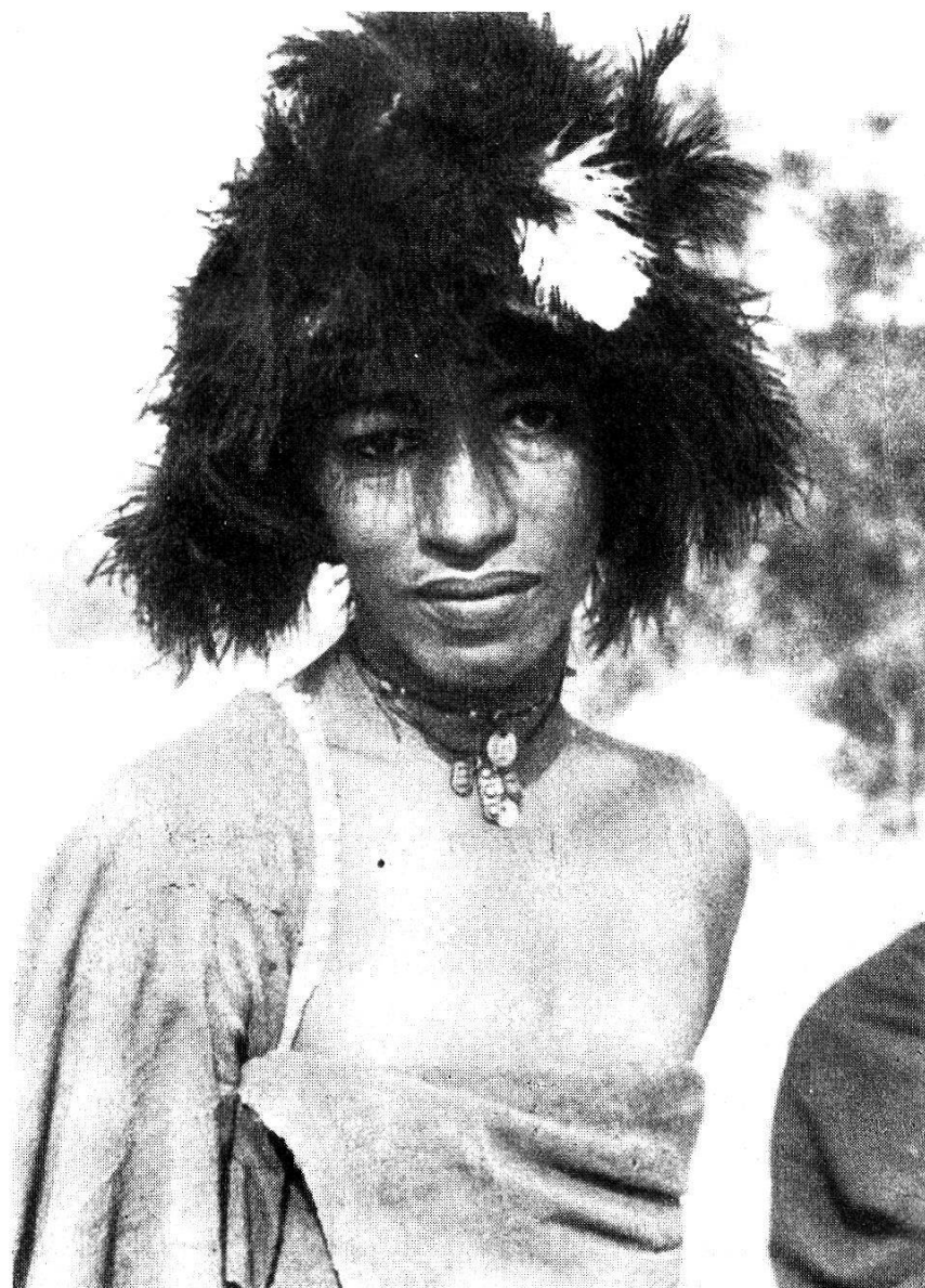
Photogr. 10. Borodji (peul païen) coiffé du « malforé » en plumes d'autruche

bijoux que nous nous procurerons ensuite chez les forgerons de Tahoua, d'In-Gall et d'Agadès. Nos circuits nous font rencontrer les Borodjis ou Peuls païens dont nous parlerons dans le chapitre consacré aux civilisations de contact.