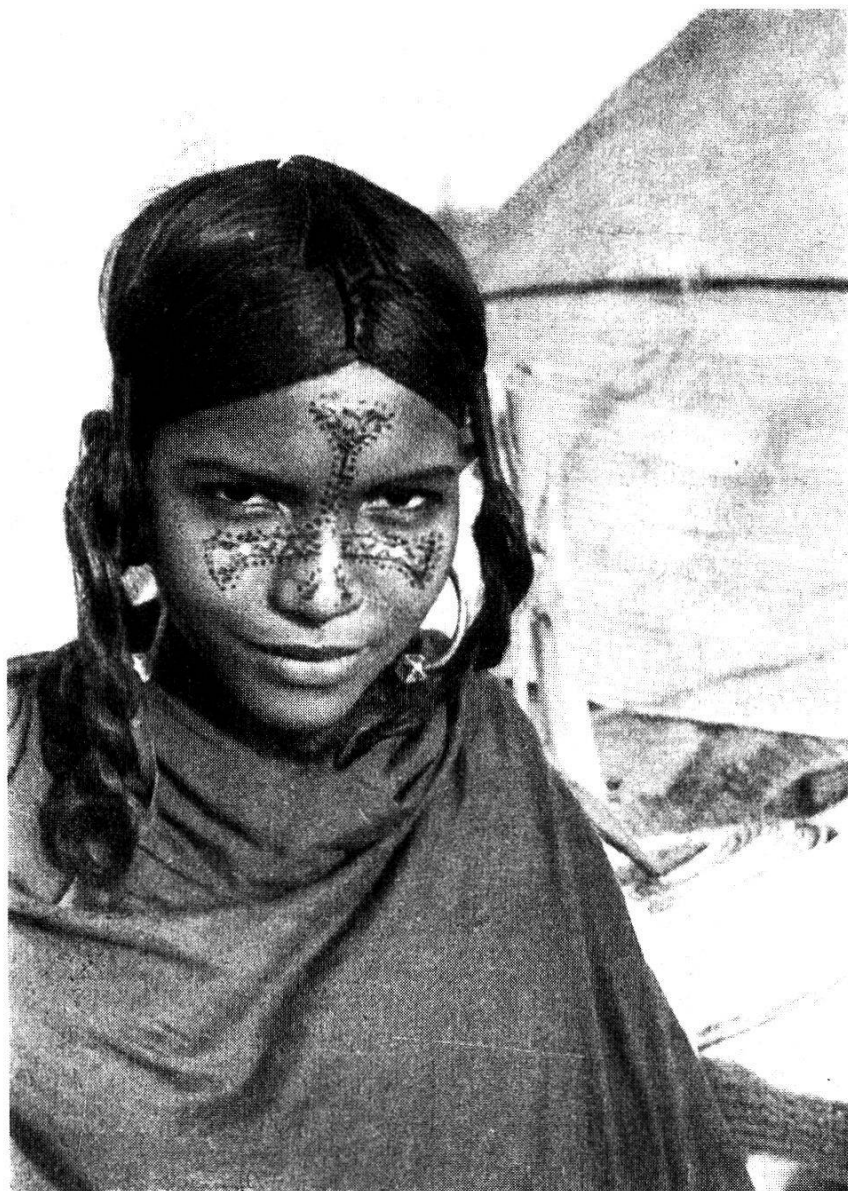
Photogr. 9. Jeune fille Hoggar de l'Aïr au visage peint.

tâche de faire accepter à Teljad la création prochaine d'une école nomade. Or ce chef répondait à ce sujet au gouverneur, quelques semaines auparavant : « Sache que je préfère égorger mes enfants plutôt que de les envoyer à ton école ! »