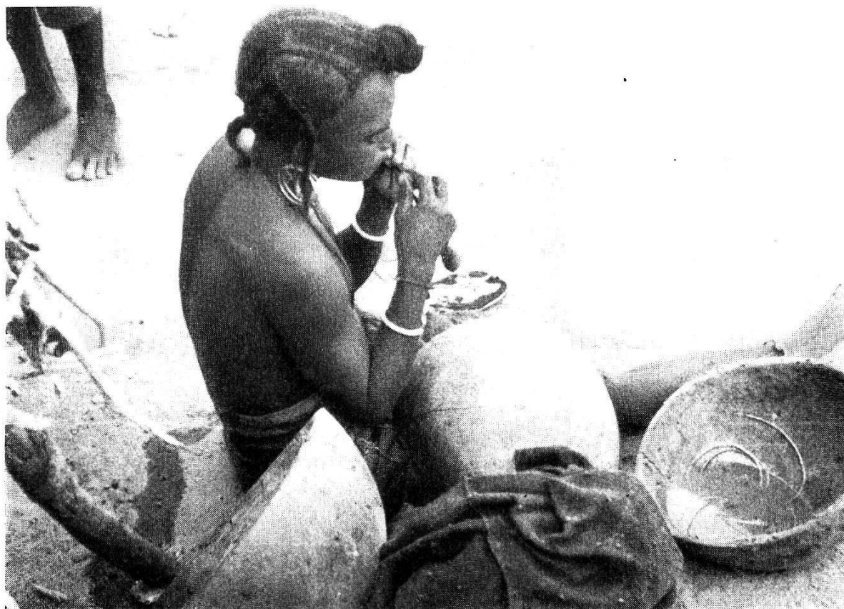
Photogr. 11. Femme peule réparant une calebasse. Des fibres de graminée sont assouplies dans l'eau et servent à resserrer les fissures pour que le récipient reste étanche. Ces Peuls, obligés de réparer fréquemment pendant leurs pérégrinations un matériel sommaire qu'ils ne peuvent remplacer sur place, sont devenus des spécialistes dans ce domaine et quand ils sont dans des villages ils exécutent ce travail pour les sédentaires.