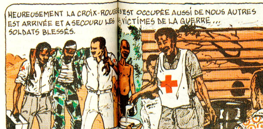
HEUREUSEMENT LA CROIX-ROUGE EST ARRIVÉE ET A SECOURU LES SOLDATS BLESSÉS.