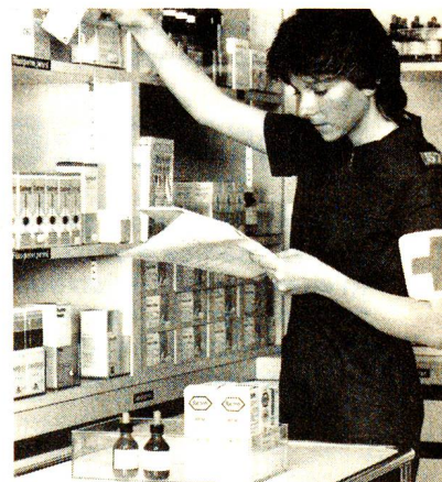
Aiuto farmacista arruolata nel Servizio Croce Rossa (SCR).

Generalmente i corsi complementari consistono nell'assicurare il funzionamento degli ospedali militari di base o dei centri per le visite di controllo sanitario degli uomini che si