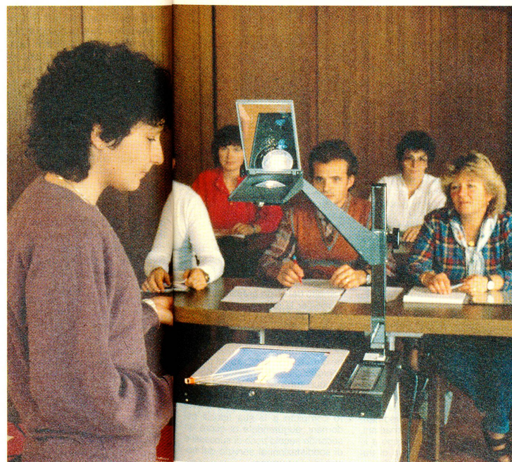
Corso di pronto soccorso. Il compito delle sezioni dei samaritani è quello di preparare la popolazione ad interventi di pronto soccorso.

vo, nel 1984 la Federazione svizzera dei samaritani entrò a far parte con tutti i diritti e doveri della famiglia della Croce Rossa. Questo passo è stato possibile grazie a una nuova visione del concetto di collaborazione, ossia che persone specializzate e volontari affrontino insieme i compiti che incombono alla Croce Rossa.