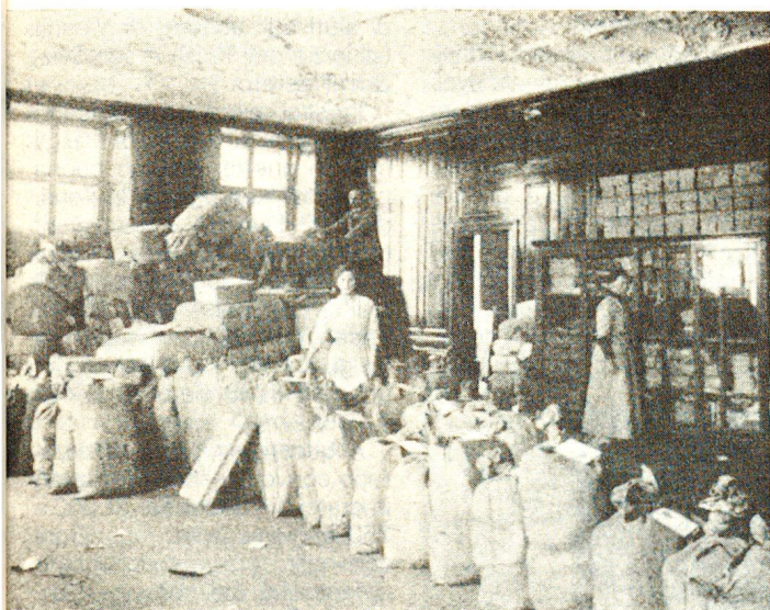
Deposito centrale: spedizione quotidiana destinata all'esercito.