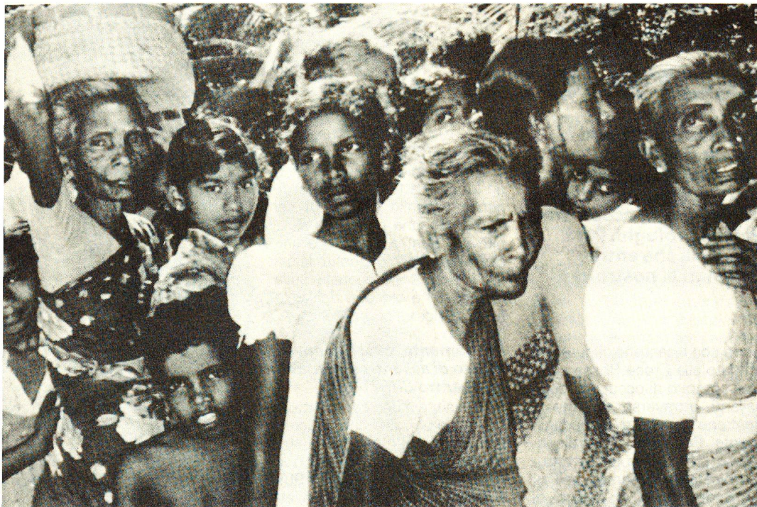
I conflitti bellici coinvolgono sempre anche la popolazione civile. Estate 1987: donne tamil fanno la coda nelle vicinanze di Jaffna per procurarsi farina e riso, riforniti dal governo indiano, dopo che gli scontri fra separatisti tamil e truppe del governo avevano provocato gravissime carestie.

Il nostro principale interlocutore è stato naturalmente il presidente della società nazionale della Croce Rossa. Ci siamo incontrati anche con alcune delle principali autorità dei ministeri degli Esteri, della Difesa, della Sanità e degli Ospedali, nonché del Ministero per la Riabilitazione, incaricato di ricondurre e ristabilire i profughi nelle regioni interne del paese. L'accoglienza è stata ovunque molto cordiale, ma non siamo riusciti ad andare al di là di colloqui informali. Abbiamo avuto la sensazione che l'attività si concentrasse quasi esclusivamente su quella del Ministero della Difesa. Purtroppo non ha avuto luogo un incontro con l'Alto Commissario del governo indiano a Colombo con cui sarebbe stato interessante intrattenersi per i suoi contatti.