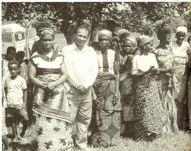
Foto di gruppo: socie del Club Croce Rossa delle Madri con un rappresentante della Croce Rossa. Sono donne che hanno una funzione importante nella prevenzione sanitaria delle zone rurali.

La fondazione di società Croce Rossa nella Guinea Equatoriale, nel Mali e nel Ghana procede lentamente, e ognuno dei programmi di sostegno segue il proprio corso prestabilito, dove giocano un ruolo preponderante la storia del Paese e della propria Croce