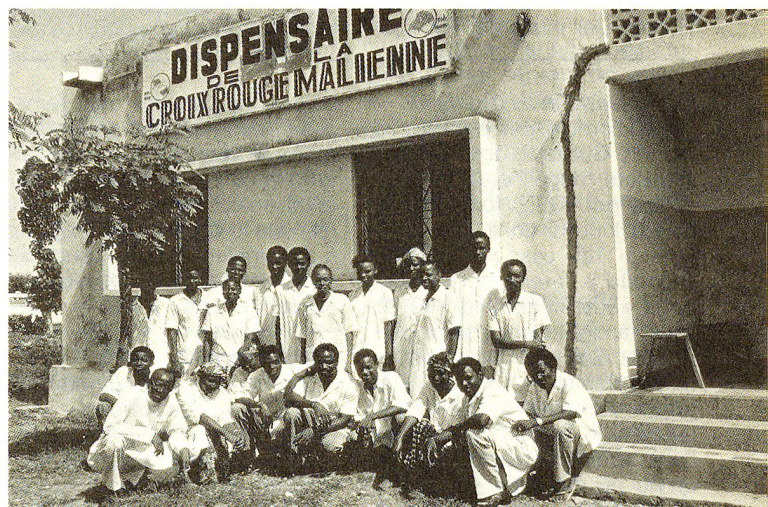
Dispensario di quartiere della Croce Rossa nella capitale del Mali, Bamako. I suoi collaboratori hanno tenuto in piedi il servizio anche in tempi difficili e con mezzi assai limitati.