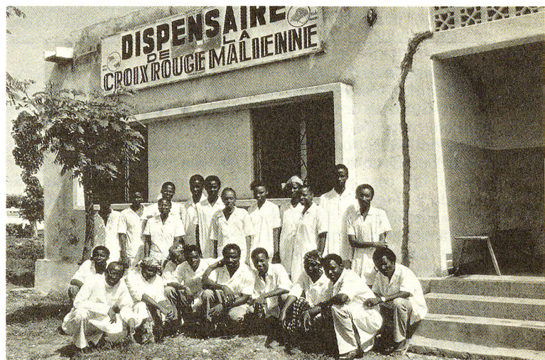
Dispensario di quartiere della Croce Rossa nella capitale del Mali, Bamako. I suoi collaboratori hanno tenuto in piedi il servizio anche in tempi difficili e con mezzi assai limitati.