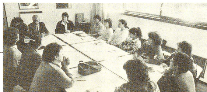
Giornata di aggiornamento per una quindicina di collaboratrici sanitarie Croce Rossa riunite a Locarno.

Nei programmi della Croce Rossa è previsto, per il 1988, un ulteriore incremento dei corsi di cure di base, al fine di poter raggiungere un numero sempre più elevato di collaboratrici sanitarie disposte sia a collaborare in modo benevolo o retribuito con i professionisti della salute, sia a intervenire nell'eventualità di catastrofi o di guerra.