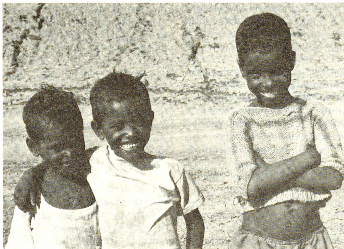
Sono poche le cose che questi piccoli profughi possono imparare. Grazie alle donazioni a favore dei padrinati CRS, imparano perlomeno le più elementari regole igieniche.

approfitta di questo nuovo servizio; una volta alla settimana infatti, il personale che lavora nel dispensario (dall'infermiera fino alla guardia notturna) si reca nelle sezioni per analizzare e discutere problemi igienico-sanitari e logistici del campo. Molte sono le donne che partecipano a questi incontri e i bambini, per esempio, imparano mentre giocano e recitano, a lavarsi le mani e a pulire il secchio dell'acqua. Questo interesse da parte del personale sanitario per i problemi della popolazione viene assai apprezzato.