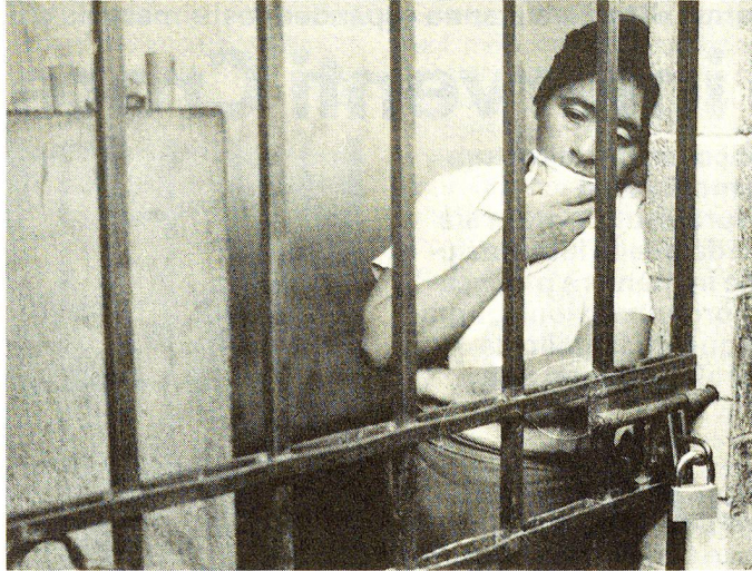
«Per i torturati il timore maggiore consiste nel sapere che nessuno conosce le loro condizioni.» Estratto dalla pubblicazione «Comitato Svizzero contro la tortura».

Perciò i promotori decisero di realizzare questa idea di Gautier prima in Europa, nella speranza che altre regioni del globo potessero seguire l'esempio. Nel 1982 il progetto per un accordo per un Comitato Europeo per la prevenzione della tortura, o di trattamenti e punizioni disumani e umilianti, venne sottoposto al Consiglio d'Europa. «Anche in questo caso», afferma il prof. Haug,