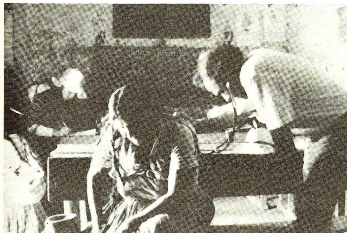
Croce Rossa Svizzera è presente dal 1981 a Chuquisaca (Bolivia) con programmi di formazione nell'ambito della salute.

posto sulle misure preventive (educazione sanitaria, campagne di vaccinazione), sulla formazione e sul perfezionamento degli operatori sanitari dei villaggi, come pure sulla rivalutazione dei loro metodi terapeutici tradizionali. Tale lavoro viene effettuato in stretta collaborazione con le popolazioni interessate.