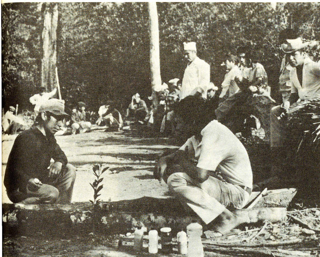
Si concluderà nel 1990 il programma di salute primaria appoggiato da una decina d'anni da CRS nel Paraguay.