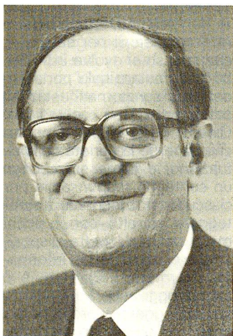
Originario di Lugano, il dott. Cornelio Sommaruga è stato eletto presidente del Comitato internazionale della Croce Rossa (CICR) lo scorso mese di maggio. La Svizzera italiana è onorata di questa nomina che vede tra l'altro in Sommaruga il primo ticinese ai vertici del CICR.

La coscienza storica non è innata negli individui e in particolare nei giovani. Ogni coscienza storica deve essere coltivata ed è quindi importantissimo che si coltivi nelle famiglie e nelle scuole. Anche